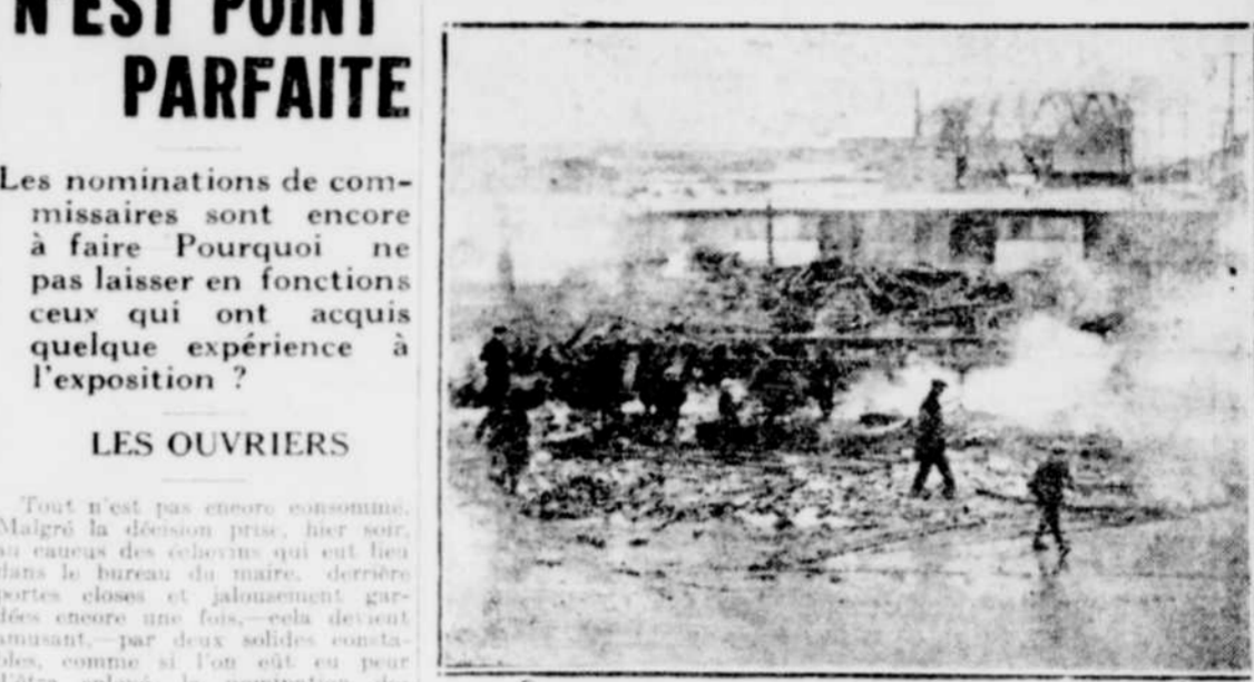
Quelques débris calcinés et fumants, voilà tout ce qui reste du magasin Vézina et Filion, incendié hier à Limoilou.