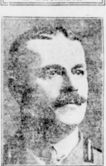
SIR EUGENE FISET, le brillant député de Rimouski, qui s'est mis en vedette aux Communes hier en demandant pour les colons du Québec une plus large part de soleil

La ville de St-Alphonse-de-Bagotville menacée d'une grande conflagration — Propriétés de M. J.-Alphonse Tremblay détruites — $125,000 de dommages — Deux autres maisons incendiées