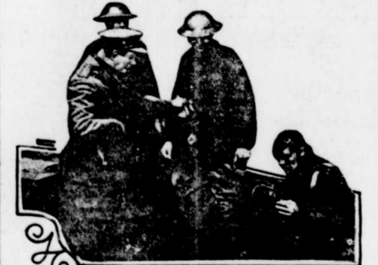
Lieut. Shankland V.C. of the Canadian Contingent in a scene from "Ypres"

Représentations les 28, 29, 30 et 31 mars. - Sous les auspices de l'Association des Vétérans de la Grande Guerre, section de Québec