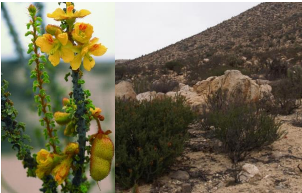
Figura 1. Fotografía de Balsamocarpon brevifolium , a la izquierda se detalla su flor, fruto y hojas, mientras que a la derecha se denota su hábitat y hábito arbóreo