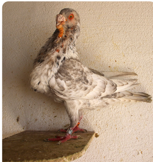
Macho pichón criador y propietario Ángel Dorta

se utilizaban para robar palomas, yo recuerdo que tenía un compañero de colegio, que le dejé un macho para criar y se le escapó y regresó a mi casa con alguna paloma de casa de este. Esa era la característica que más se buscaba en estos palomos. No era un palomo de posarse en otros palomares, se ponía a dar vueltas