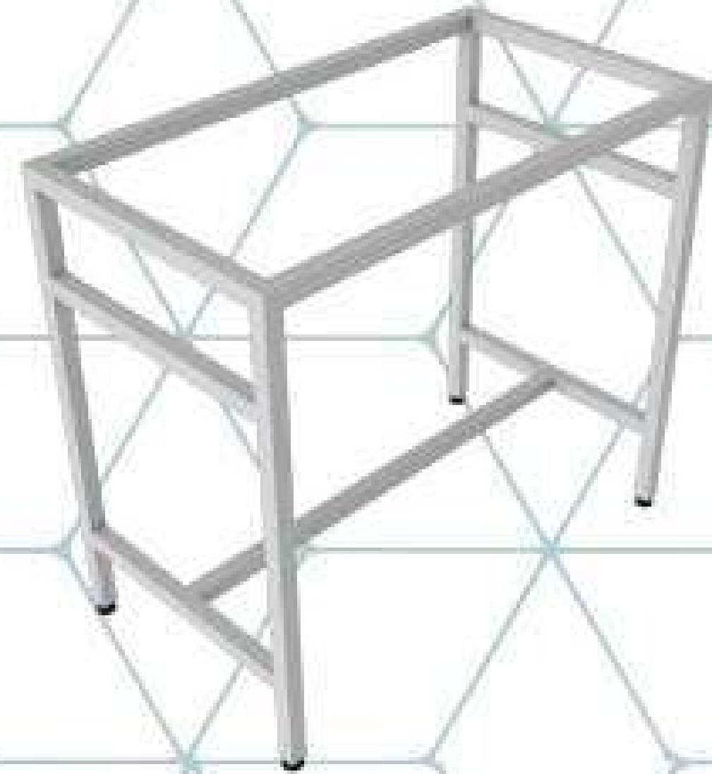
MESA DE ASNILLAS SENCILLA

Mesa estructural fabricado en perfil tubular rectangular de 1-1/4" x 1-1/4" con acabado con pintura híbrida epoxi-poliéster en polvo de aplicación electrostática.