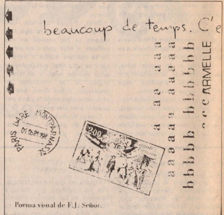
Poema visual de E.J. Señor.

En una de estas excursiones por las interioridades de la casa encontré una maleta. Y al abrirla hice un descubrimiento para mí de aún mayor importancia que el del zepelín.