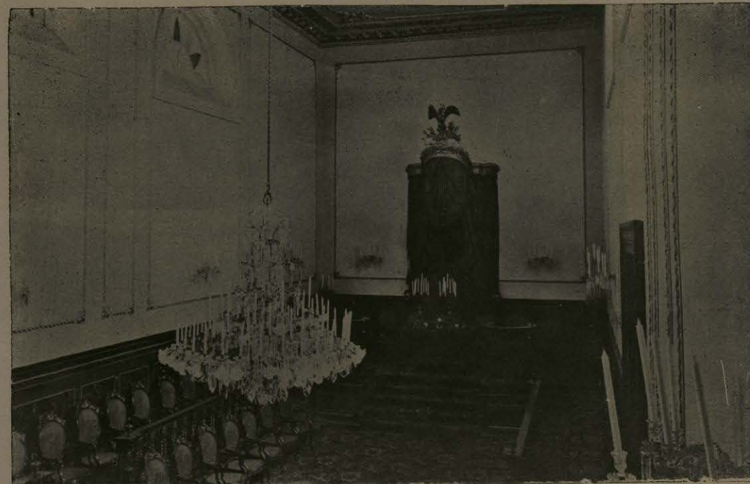
CAMARA DE SENADORES.

He visitado la Catedral i los templos de San José, San Agustin, Santa María de Gracia, Mexicaltzingo, San Juan de Dios i el Carmen, que aunque conserva una que otra buena escultura i una que otra buena pintura, i es uno de los templos mas graciosos de Guadalajara, no es mas que el esqueleto (fijense los lectores en la palabra) del templo i convento del Padre Nájera. ¡El tendajon del Pavo ha sobrevivido e impuesto su nombre a aquella magnificencia! He estado en el antiguo coro bajo de Jesus María en donde he visto la antigua Imagen de San Gonzalo, trasladada a este rincón por causa de un jarabe.