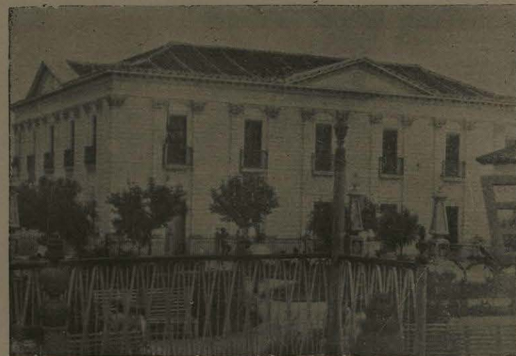
CASINO DE COMITAN.

Ciertos hechos que parecen casuales. Os son bien conocidos, la lámpara que balanceó delante de Galileo a los dieciocho años; la manzana que cayó á los ojos