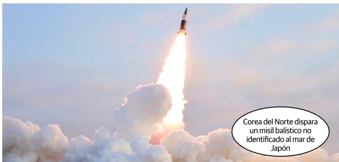
Corea del Norte dispara un misil balístico no identificado al mar de Japón