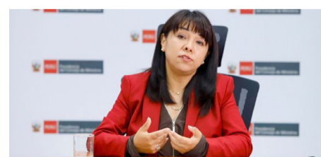
Expremier Mirtha Vásquez desobedece a la autoridad

Se va recuperando la normalidad en el país