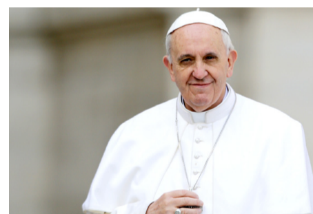
Papa Francisco pidió la paz en el Perú

Se va recuperando la normalidad en el país