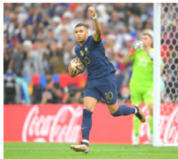
figura de Emiliano Martínez para evitar lo que era el cuarto gol galo.

mandar este encuentro a la tanda de penales. Antes del pitazo final apareció la