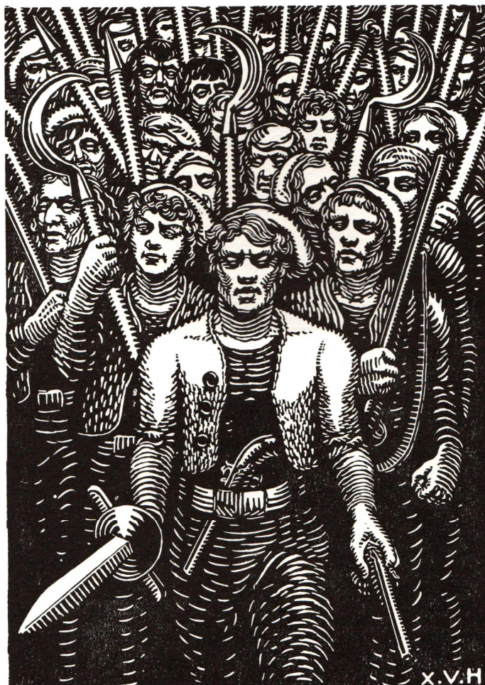
Les Bonnets rouges (X. Haas)

Plaidoyer pour une mythanalyse - Ivens saga - du mythe au roman - Yvain chaman occidental - tradition & individualité dans le conte gallois d'Owein - Yvain & la logique hexagonale - le chevalier au lion : un jeu de cache-cache ? - les taureaux & leur maître - etc.