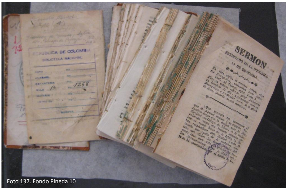
Foto 137. Fondo Pineda 10

Libro desencuadernado con hojas y cuadernillos sueltos.