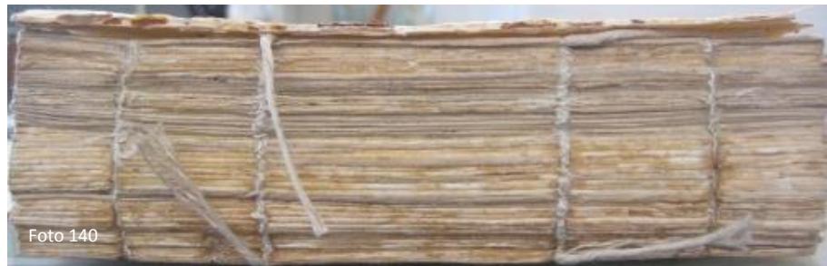
Costura tipo cadeneta.