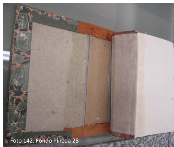
Último paso de la consolidación del lomo del cuerpo de texto con tarlatana en tela caleñita.