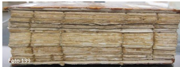
Lomo de cuerpo de texto antes y después de la limpieza en húmedo.