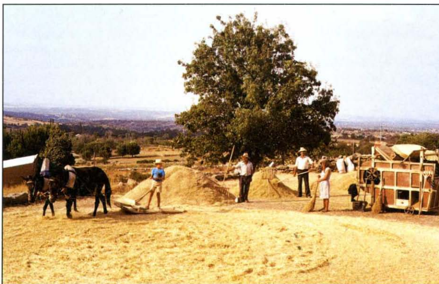
La trilla en la era.