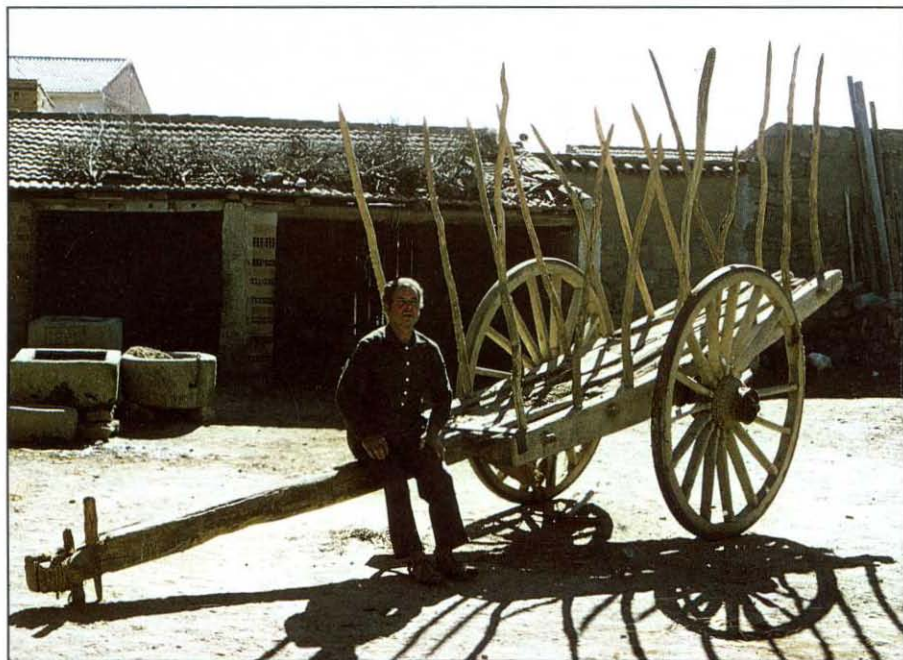
Carro de labranza.