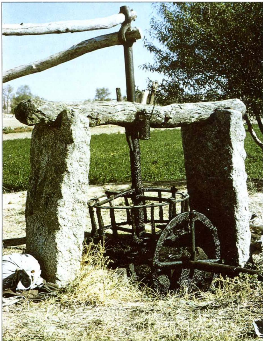
La vieja noria.