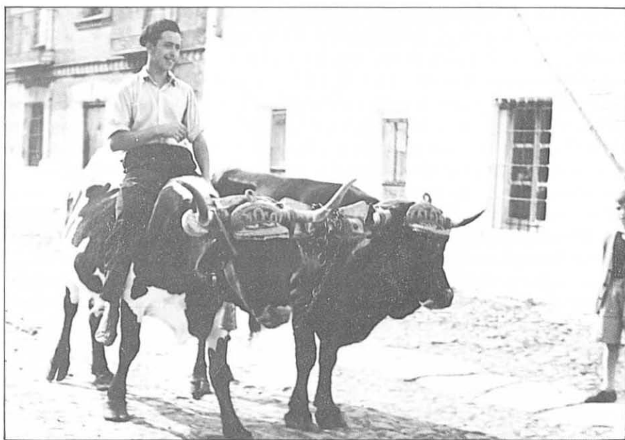
Yunta de bueyes

transportable o en una mampara , tienda de campaña; al lado montaban las perneras donde colgaban un caldero para calentar al fuego las sopas canas y la leche con cuajo de cordero (tripas de chivo recién nacido), y hacer el queso en el exprimijo, prensando la cuajada en el cincho de empleita o pleita para que salga el suero; se acompaña de perros mastines a los que daba de comer la pella o pellada compuesta de harina de cebada muy amasada con agua, y para protegerlos de las mordeduras de los lobos les ponían la carbanca o carlanca , collar de púas de hierro.