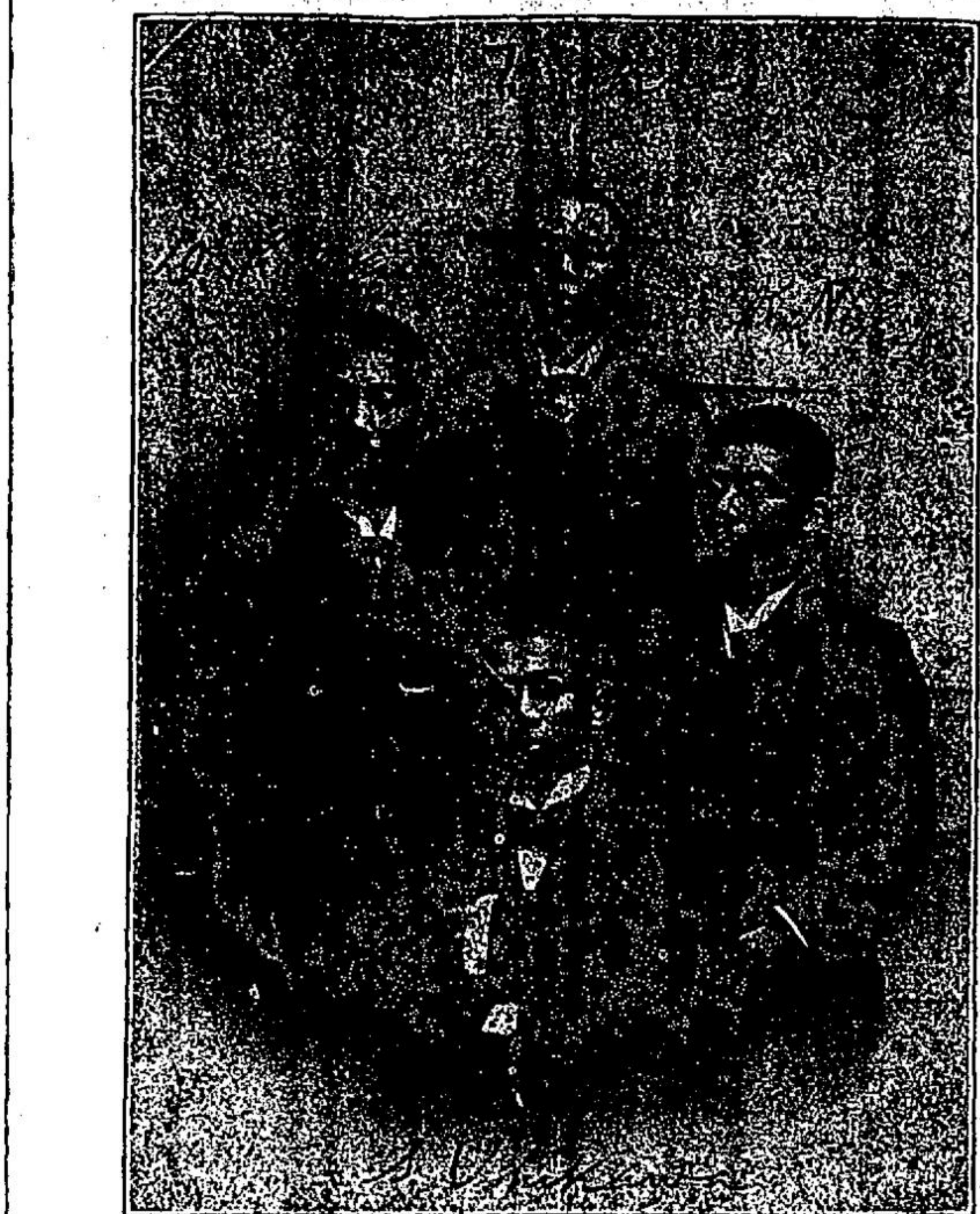
Redactores del periodico "Chokugen", (Adelante) condenados a Muerte