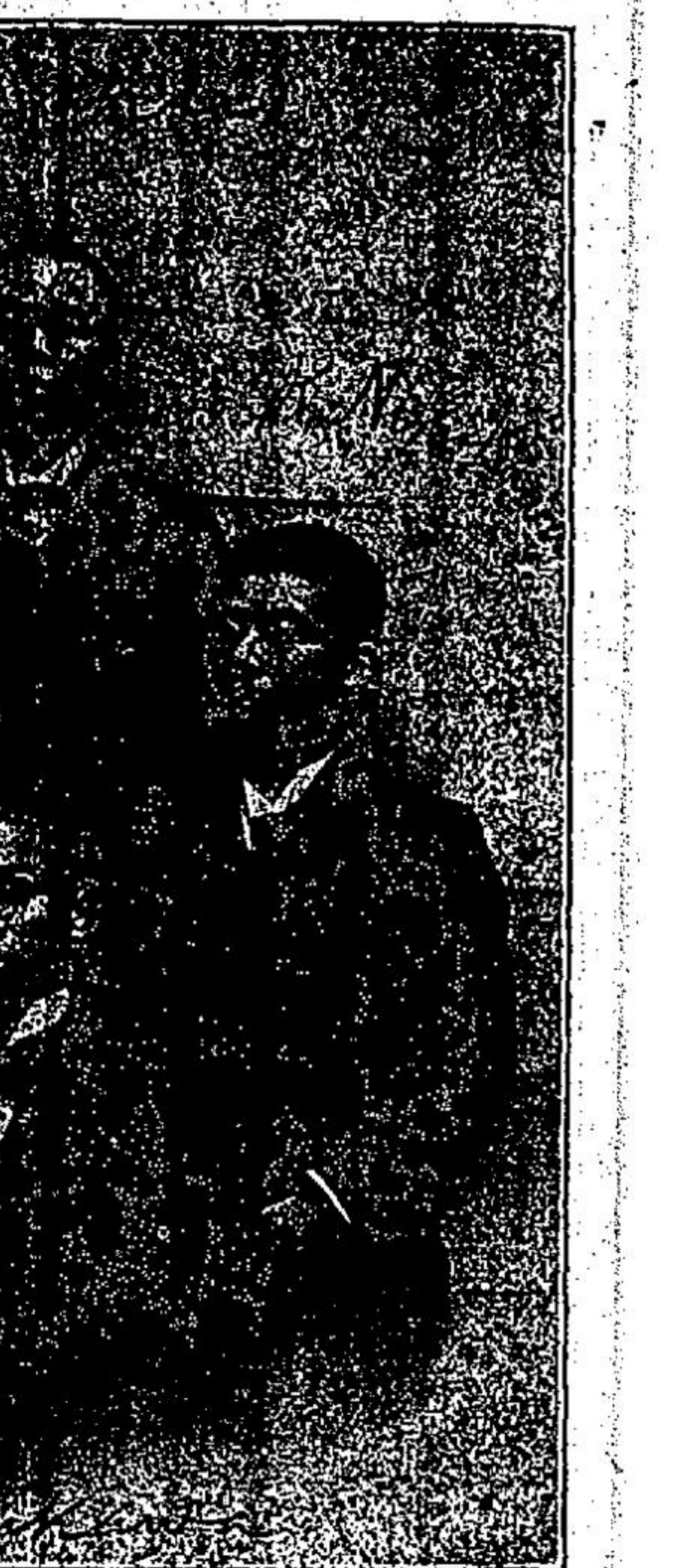
Redactores del periodico "Chokugen", (Adelante) condenados a Muerte

ternacionales; esto es, a donde quiera que vayan y existan Uniones de su gremio, serán reconocidos por estas sin que tengan que erogar nuevos gastos.