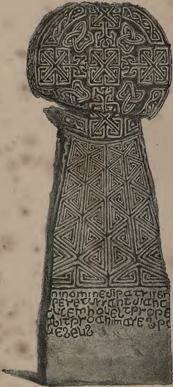
RHYS'S CROSS, LANTWIT.