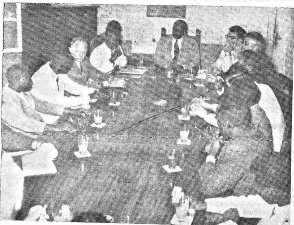
La riunione nella sala del Consiglio dei Ministri tra la Missione di visita ed il Governo. Al centro l'Ambasciatore Dorsville e che ha alla sua destra il Primo Ministro

territorio in simpatica e vivace conversazione. Oseremmo dire che la naturale severità della sede dell'Assemblea Legislativa si è presa ieri pomeriggio un po' di vacanza per lasciare il posto ad una più disinvolta animazione. I Membri della Missione hanno avuto occasione, dopo il primo fugace incontro di giovedì, di venire nuovamente