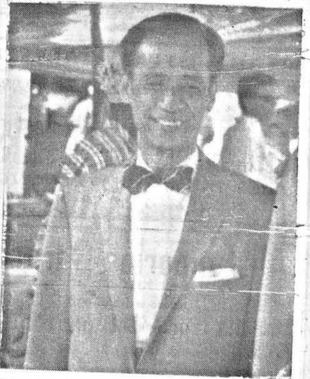
Il Ministro Mauro Baradi

Al momento dell'arrivo il Presidente del Consiglio Consultivo delle Nazioni Unite, Ministro Mauro Baradi, ha rilasciato alla stampa la seguente dichiarazione: