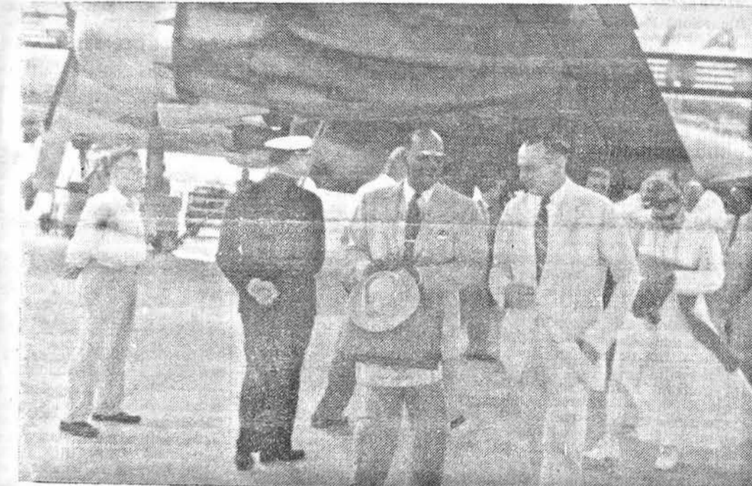
Il Reggente l'Amministrazione con il Presidente della Missione di Visita subito dopo l'arrivo.

Consultivo delle Nazioni Unite, la mia volontà di aiutare il Popolo della Somalia, in cooperazione con l'Amministrazione Italiana, a raggiungere la sua indipendenza nel 1960». «I somali sono pieni di volontà e di risorse e non possono, quindi, non realizzare le molte responsabilità insite in una esistenza indipendente. E, poiché, essi desiderano assumere tali responsabilità, il Rappresentante delle Filippine al Consiglio Consultivo, farà del suo meglio per aiutare la Somalia a diventare una nazione sovrana».