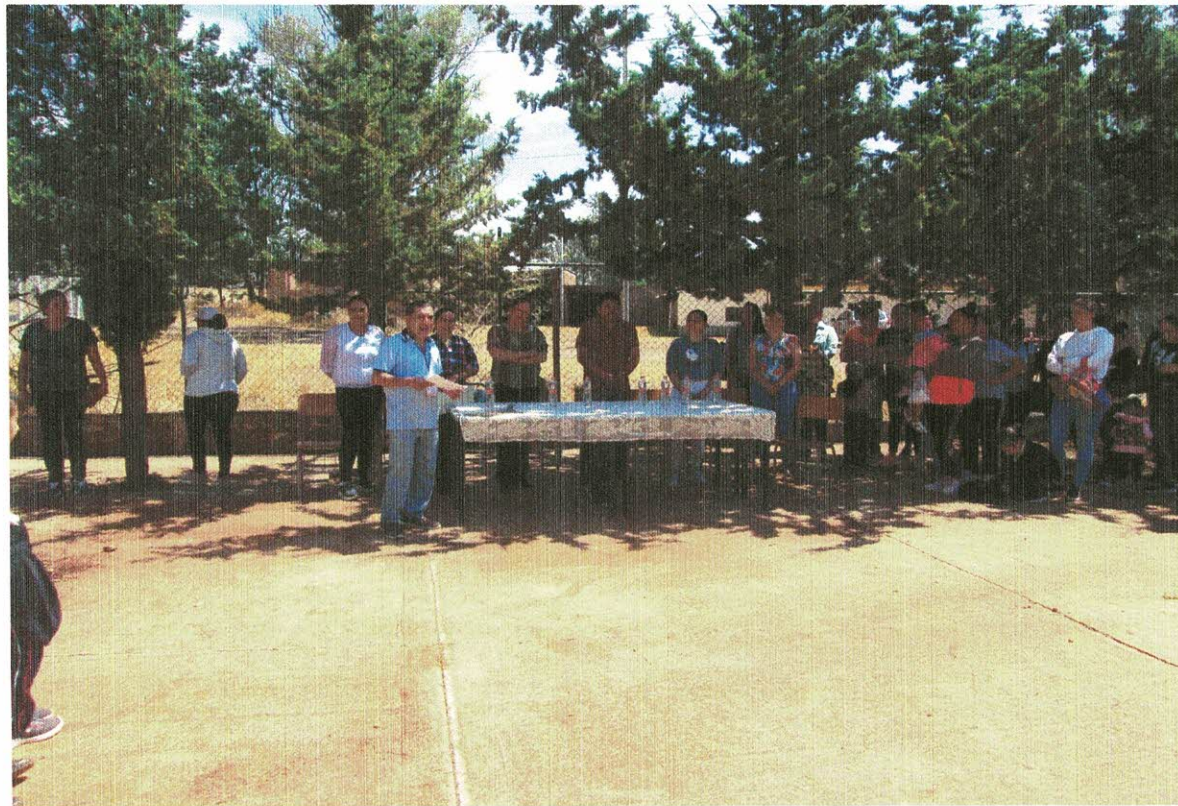
CONSTRUCCION DE TECHADO EN AREA DE IMPARTICION DE EDUCACION FISICA EN LA ESCUELA PRIMARIA JUSTO SIERRA EN LA COMUNIDAD DE LA CIENEGUITA MPIO. DE ARANDAS JAL.