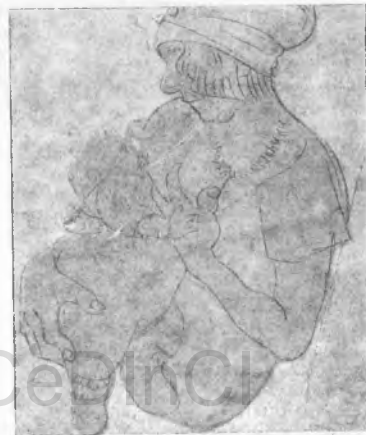
Apunte de Diego Rivera

Los discípulos de Rivera decoran los corredores y escaleras de la Escuela Preparatoria y decoran también parte de la Secretaría de Educación. Ninguno de ellos, seguramente ha alcanzado la perfección del maestro; pero juntos, con Rivera al frente y unidos a otros pintores que representan otras tendencias (Montenegro, Atl, Orozco, Ramos Martínez), trabajan todo el día en una obra que, cualesquiera que sean sus defectos parciales, es grandiosa por su concepción, grandiosa por su realización: la obra pictórica más importante de América la hacen ellos.