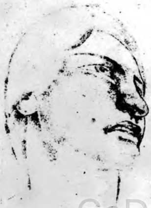
Apunte de Diego Rivera.

rivales; había ya movimiento, agitación, que habilmente se encargaba de exagerar el poeta José Juan Tablada, propagandista literario de los pintores tapatíos. En 1906 se hace la exposición del