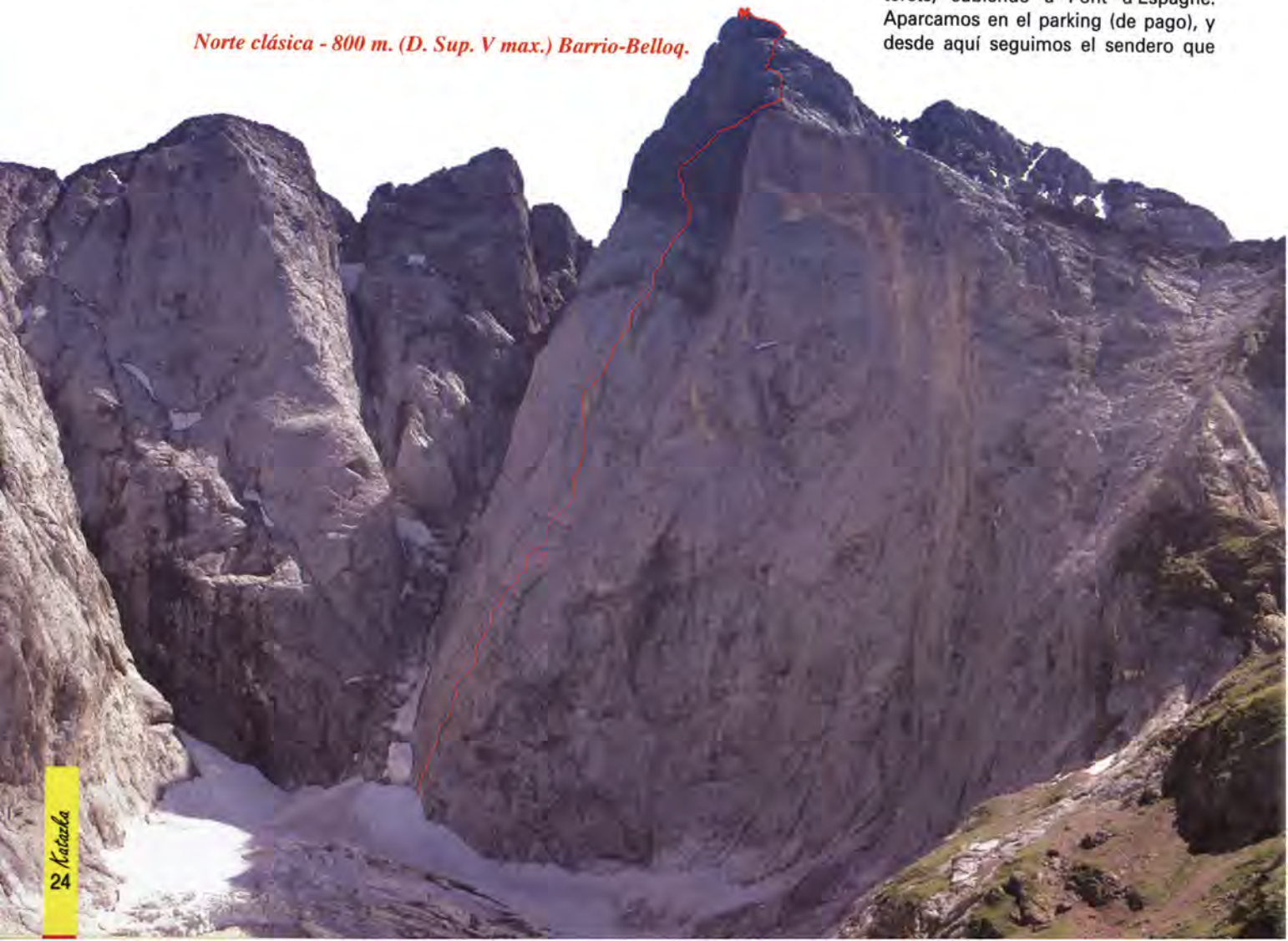
Norte clásica - 800 m. (D. Sup. V max.) Barrio-Belloq.

La más recomendable es desde Cauterets, subiendo a Pont d'Espagne. Aparcamos en el parking (de pago), y desde aquí seguimos el sendero que