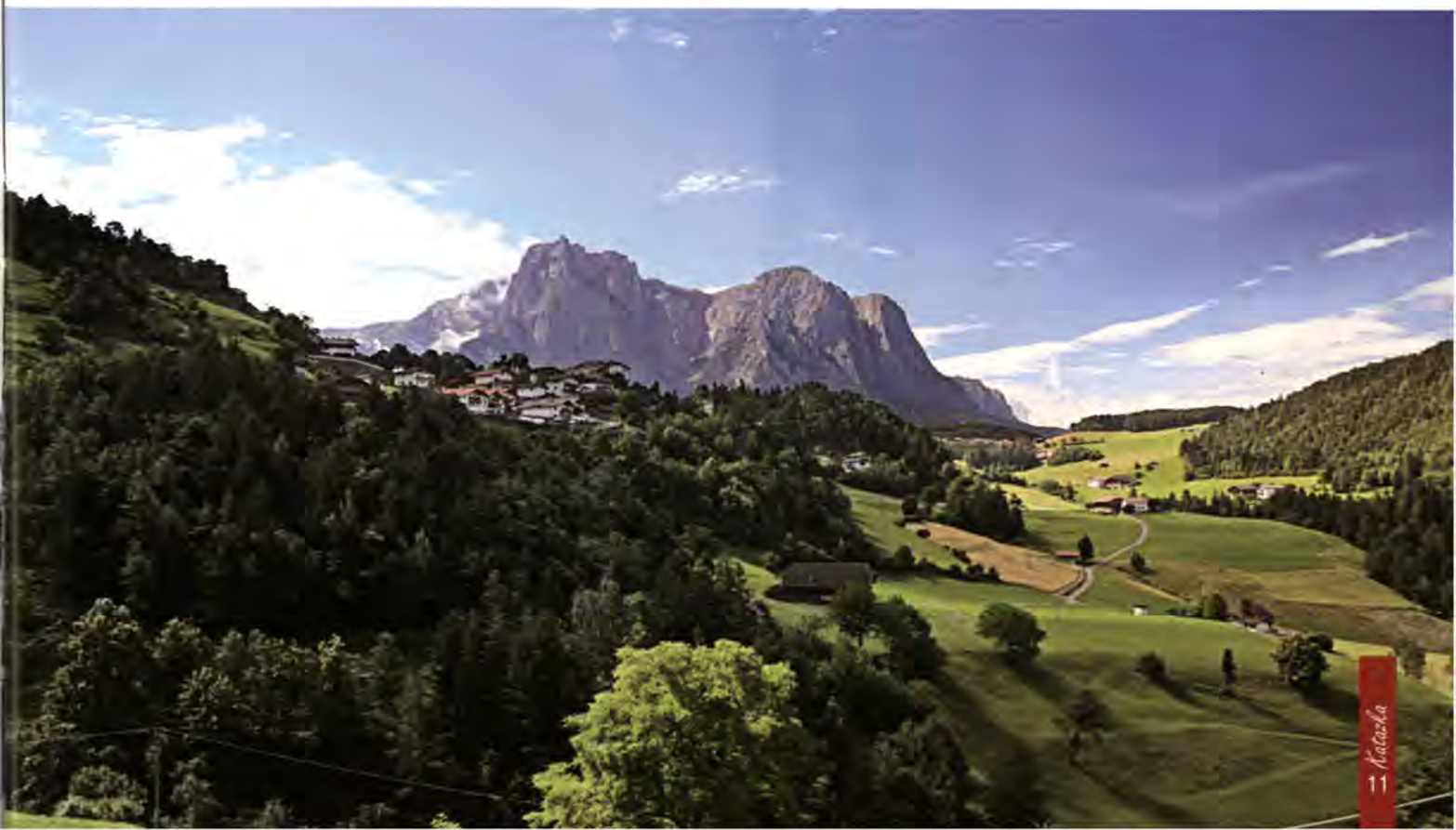
Foto: Schlern desde Tisens.

Insistimos en que este plan es, de momento, tan sólo un proyecto. Intentaremos que la realidad se asemeje a él. Ahora, la pregunta del millón: ¿el precio? Os lo contaremos todo el día de la presentación, que será el 2 de junio a las 8 de la tarde. Lo confirmaremos con antelación en nuestra página web y en el escaparate.