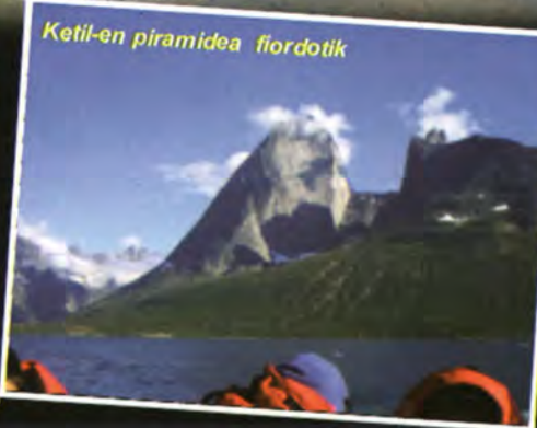
Ketil-en piramidea fiordotik