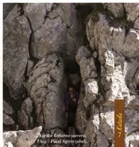
Nardin kobaren sarrera.