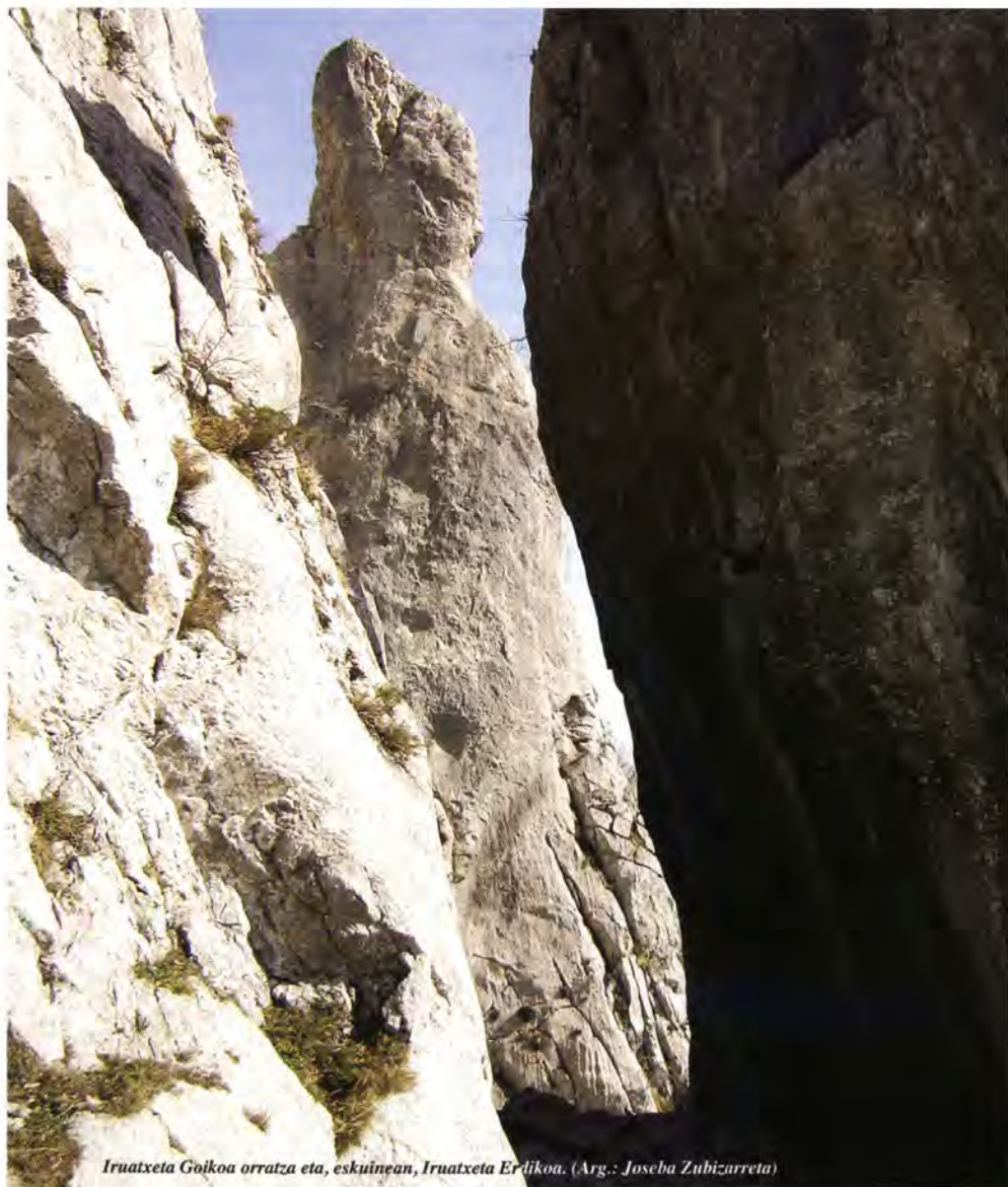
Iruatxeta Goikoa orratza eta, eskuinean, Iruatxeta Erdikoa.