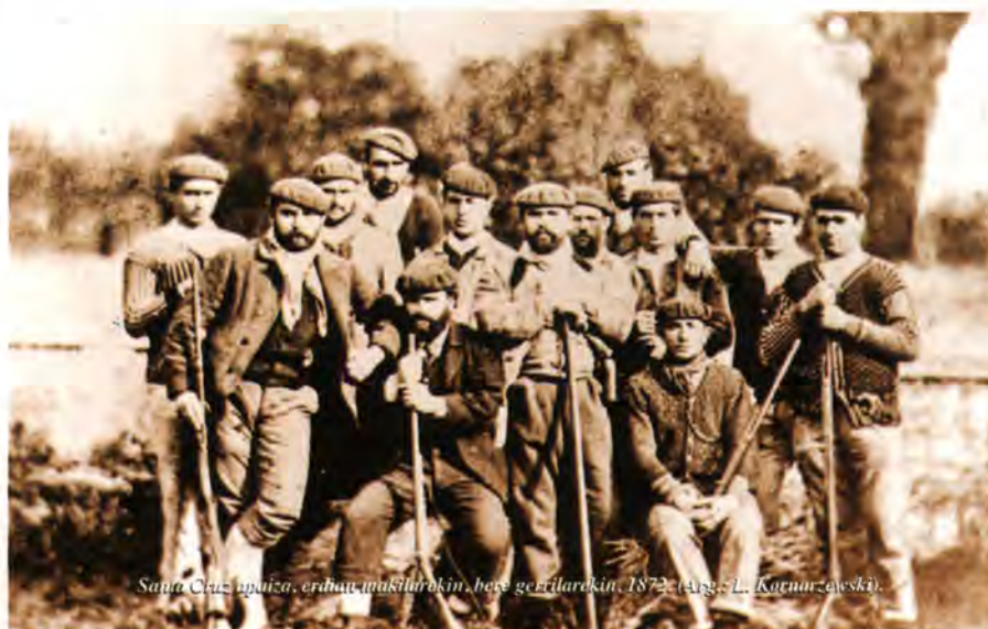
Santa Cruz apaiza, eraman makilarekin, bere gerrilarekin, 1872.