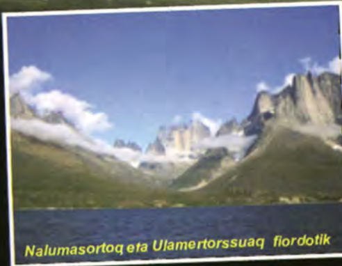
Nalumasortoq eta Ulamertorssuaq fiordotik