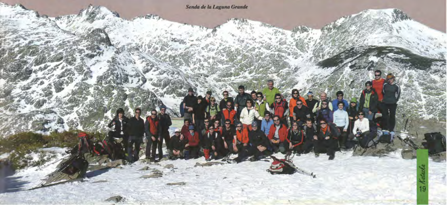
Senda de la Laguna Grande