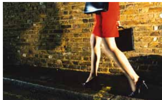
Gas, de la sección Hitchcock without Hitchcock