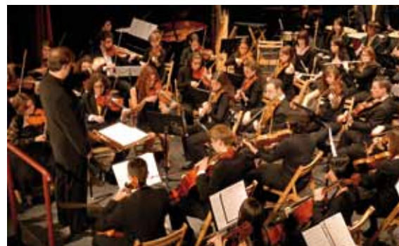
Concierto orquesta Ciudad de Alcalá