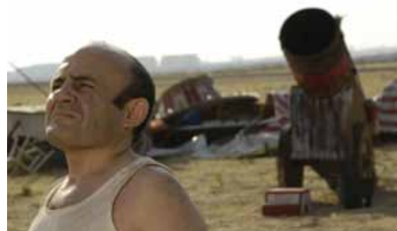
El gran Zambini, de la sección Cine accessible