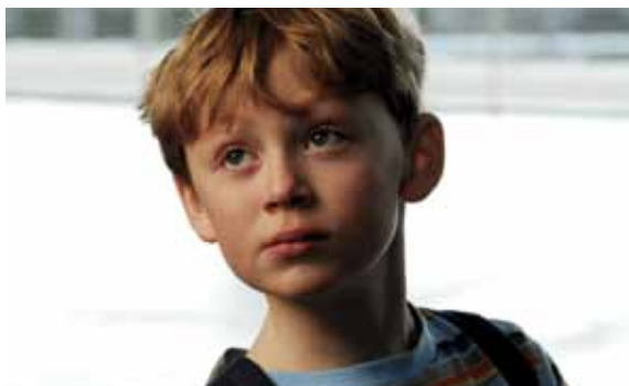
Transit, de la sección Idiomas en corto