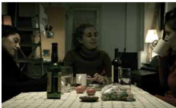
Ponys, de la sección Cine accesible