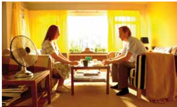
Lägg M för Mord, de la sección Short Matters