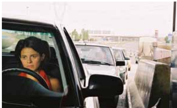
Sontonia, dentro del ciclo Cine Accesible

En esta sesión, podremos ver alguno de los mejores cortometrajes españoles de la última década.