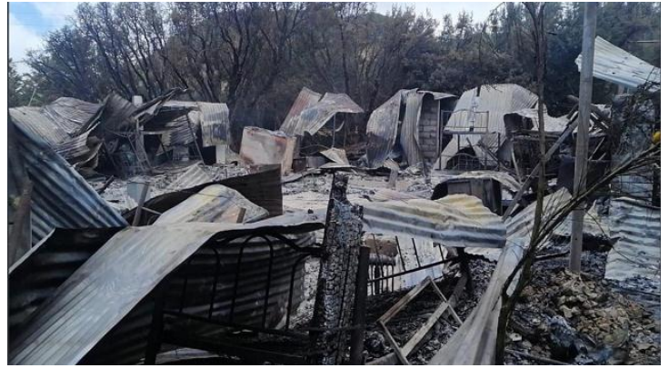
Instalaciones antes y después del atentado.

El pasado 4 de octubre la empresa Ecuagold Mining South América S.A., titular del proyecto Río Blanco, informó que sus instalaciones habían sido atacadas nuevamente, esta vez, en el contexto de la movilización que viene protagonizando el movimiento indígena ecuatoriano.