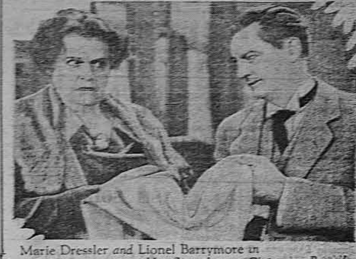
Marie Dressler and Lionel Barrymore in "Her Sweetheart (Christopher Bean)"

Marie Dressler, la artista que ha hecho reír y llorar a la humanidad, en su más grande producción "EL DIFUNTO CHRISTOPHER BEAN" el jueves Para el sábado, la selva con todas sus monstruosidades tropicales ante sus ojos: "EL MONSTRUO DE LA SELVA"