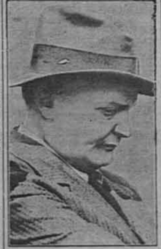
GOERING, presidente del Reichstag y actual miembro del gabinete alemán, que protestó en una carta enviada a Estocolmo contra un artículo publicado por un diario de Suecia contra el canciller Hitler, despreciando tal carta considerable indignación en los círculos periodísticos de Estocolmo.

Buenos Aires, 10. — El aviador francés Jean Mermoz, que efectivamente el vuelo transatlántico con seis pasajeros, salió hoy en la madrugada para Río Janeiro. A las 9.45 de la mañana el avión dio por inabundante la siguiente posición: 20.50 grados de latitud sur y 49.44 de longitud oeste.