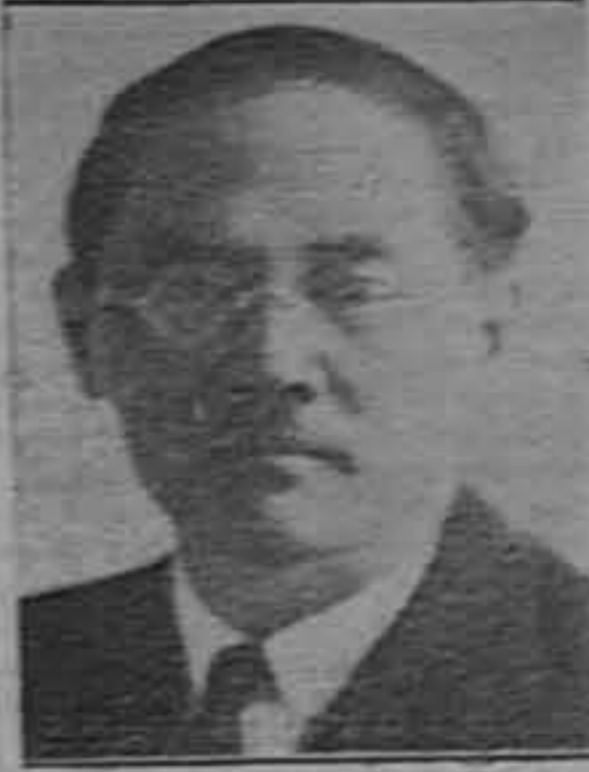
EUGENIO CHEN, ex-Ministro de Estado de China, de quien se dice que está concertando en París la alianza militar entre China y Rusia, no obstante que la noticia es desmentada por la Embajada soviética en Francia.

Madrid, 9. — Por decreto del Ministerio de Agricultura el maíz extranjero que se importe en España para el consumo, pagará en adelante 5 pesetas oro por quintal métrico, sin descuentos de procedencia o de fecha de embarque.