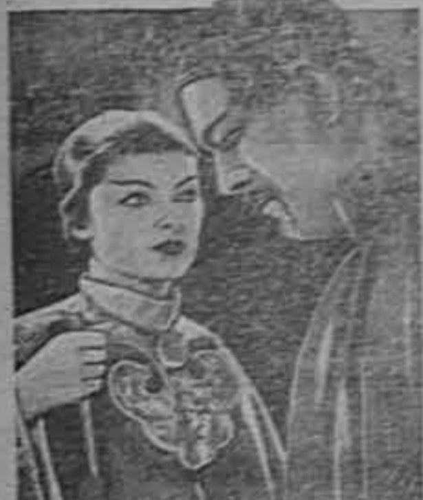
MYRIA LOY and BORIS KARLOFF in "THE MASK OF FU-MANCHU"

Algo poderoso, espectacular, dramático, es la super-producción Metro Goldwyn Mayer "LA MASCARA DE FU-MANCHU" que estrenan el domingo los teatros Variedades, América y Adela