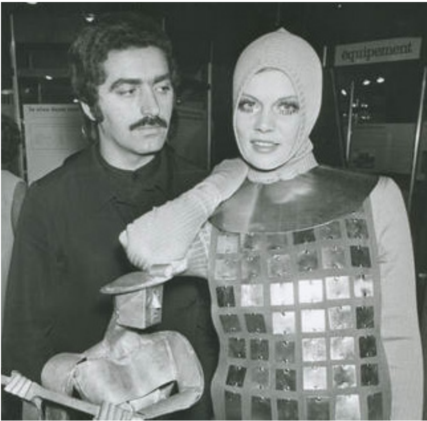
Fig. 2. La nueva cota y armadura de Paco Rabanne en 1966, como propuesta futurista.

Sólo Moda, Paco Rabanne, RTVE.es www.rtve.es