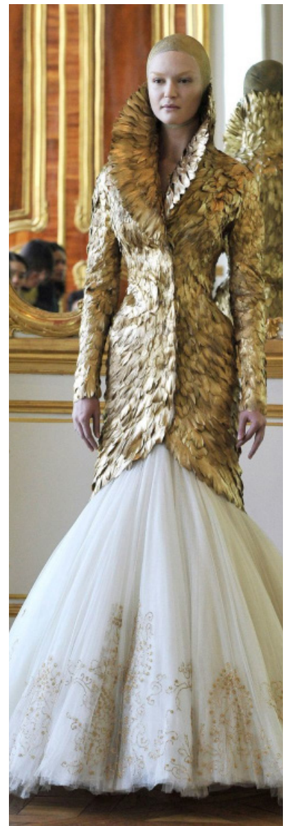
Fig. 9. Colección póstuma de Alexander Mc Queen, en 2010. El vestido se basa en las aves, según el bestiario medieval, símbolos de buen agüero por su proximidad con el cielo.

http://cultura.elpais.com/cultura/2010/03/10/album/