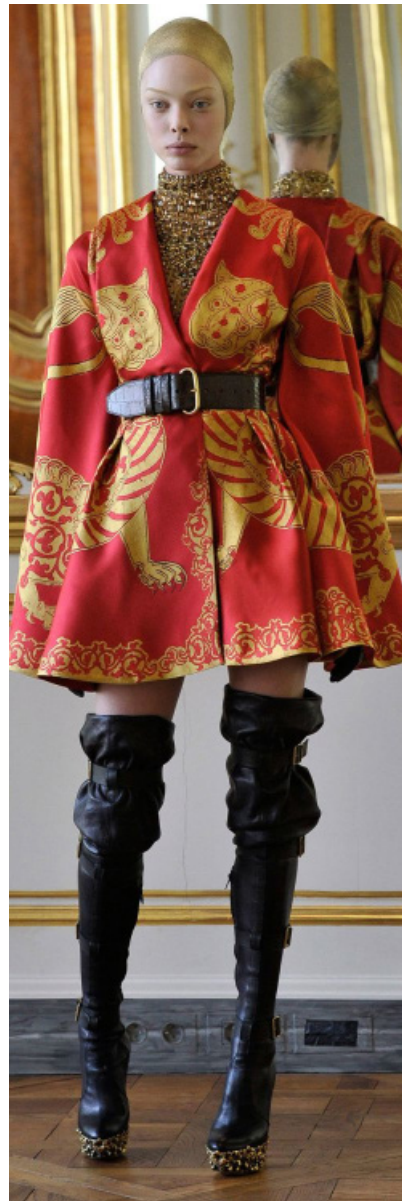
Fig. 8. Los leones característicos de la corona británica fueron un motivo recurrente en la carrera de Alexander McQueen, desde su primera colección en 1994. La imagen del león en su colección de 2010, recuerda los bestiarios medievales.

http://www.style.com/slideshows/fashion-shows/fall-2012-ready-to-wear/lanvin/collection/3