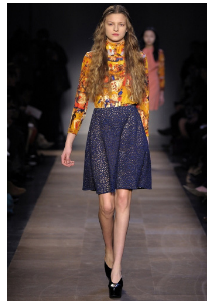
Fig. 3. Colección de Guillaume Henry para Carven en 2012. Estampado de la obra de la Edad Media «El jardín de las Delicias» de Hieronymus Van Aken, «El Bosco», de 1510 sobre el tejido.

La colección póstuma del prestigioso diseñador Alexander McQueen, se presentó durante la semana de la moda de París, el 10 de marzo de 2010, cuando justo se cumplía un mes de su muerte. Sólo se hizo un pase privado a reconocidos periodistas y se presentaron quince piezas, todas ellas con fuertes connotaciones religiosas e inspiradas en el artista holandés. « El Bosco se hizo famoso por sus representaciones del Infierno y sus moradores », 15 y McQueen consideraba «El jardín de las delicias» uno de sus cuadros preferidos. Según E. H Grombrich, con esta obra, « por primera vez y acaso por única vez, un artista consiguió dar forma concreta y tangible a los temores que obsesionaron al hombre del Medioevo » 16 . Alexander McQueen diseñó su última colección abrumado por el dolor de la enfermedad y posterior muerte de su madre, Joyce, a la que estaba muy unido. Aunque la inspiración medieval podría suponer la utilización de técnicas artesanales,