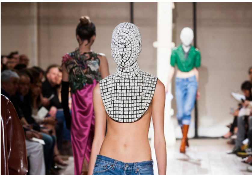
Fig. 6. Estilismo del desfile de Alta Costura de Maison Martin Margiela en 2013. La modelo parece llevar un almófar medieval.

http://madame.lefigaro.fr/defiles/maison-martin-margiela/automne-hiver-2013-2014/haute-couture-0/433122