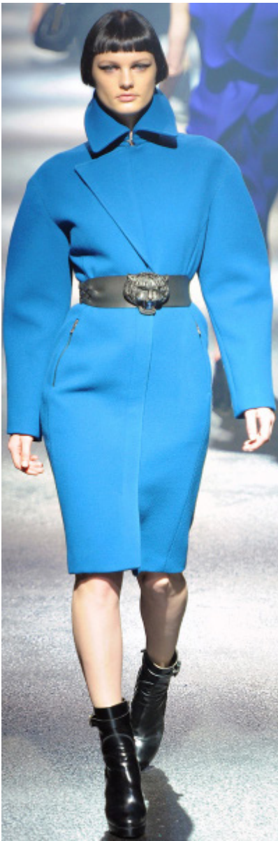
Fig.7. Colección otoño- invierno de de 2012, de la firma Lanvin. En la edad media el león era considerado portador de valores positivos, aquí reinterpretado como adorno del cinturón.

http://www.style.com/slideshows/fashion-shows/fall-2012-ready-to-wear/lanvin/collection/3