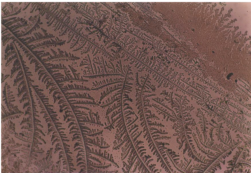
Fig. 1: En la esquina superior derecha de la imagen se puede ver moco P, por debajo del mismo y formando hileras ramificadas vemos moco S, a continuación de mayor tamaño y ocupando la mayor parte de la imagen vemos moco L. De: C. Medialdea. Tesis doctoral.

Para poder observar los distintos tipos y subtipos utilizó la técnica de extensión en todas las direcciones (Spread it out) que autores como Temprano (1994), Menárguez (1998) y Medialdea (2004) confirmaron años más tarde como fundamental en sus observaciones de los distintos tipos y subtipos de moco cervical en una misma muestra, las tres investigadoras han podido observar además todos los tipos y subtipos de cristalización característica descritos por Odeblad así como les ha resultado de utilidad su diagrama de porcentajes para conocer el momento aproximado del ciclo al que pertenece cada muestra obtenida en la consulta.