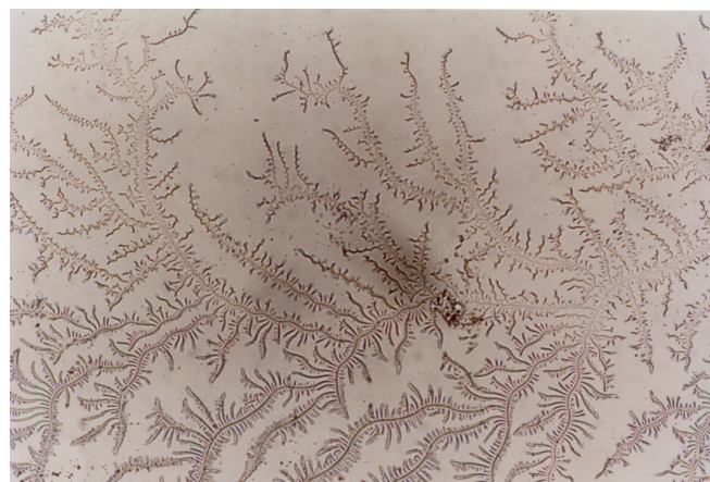
Figura 2: 10X. Sin cubre: Debajo vemos moco L, y arriba vemos moco Pt. Parece que el moco L se transforma en moco Pt. 5-CI. Día del ciclo aproximado: 0. De: C. Medialdea. Tesis doctoral.

Encontró también algunas diferencias en los distintos momentos del ciclo ovárico a nivel de las proteínas solubles que forman parte del hidrogel cervical. Así, la proteína D se reveló como específica de fase posovulatoria y la presencia de otras proteínas que denominó A, B y C mostraron variaciones típicas en los distintos momentos del ciclo ovárico. Estos hallazgos ayudan a pensar que en el caso de los tipos de moco L, S o P descritos previamente por Odeblad se trataría de una misma glucoproteína (glucoproteína E) que sin embargo variaría su configuración con cierta facilidad por contener pocos enlaces y débiles y constituiría las distintas estructuras de red correspondientes a estos tres tipos. Algunas imágenes de cristalización captaron la transformación desde una configuración hasta otra, en concreto moco L transformándose en moco de tipo P. Esta investigación parece confirmar que el moco G se corresponde con una única glucoproteína que no varía su configuración por contener, tal como supuso Odeblad, más enlaces y más fuertes que el moco de tipo E.