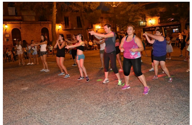
Zumba en Plaza de España