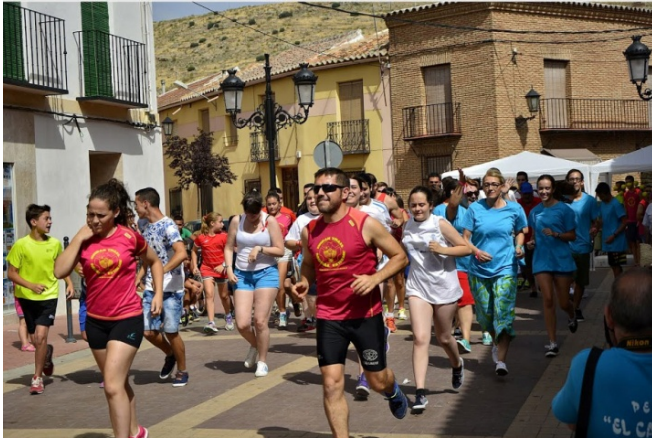
Carrera del Melón