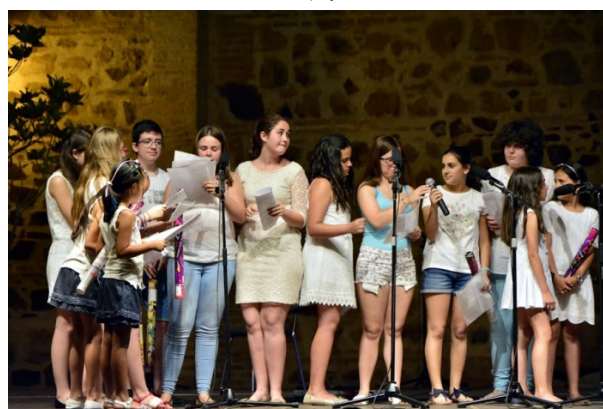
Escolanía Iglesia Parroquial