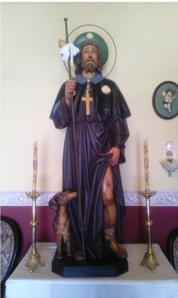
San Roque de la cruz Protector y Copatrón de Moral de Calatrava