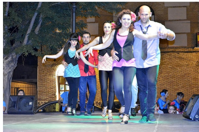
Bailes de salón