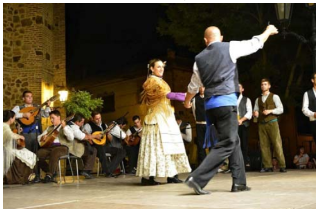
Actuación asociación cultural Senojiles