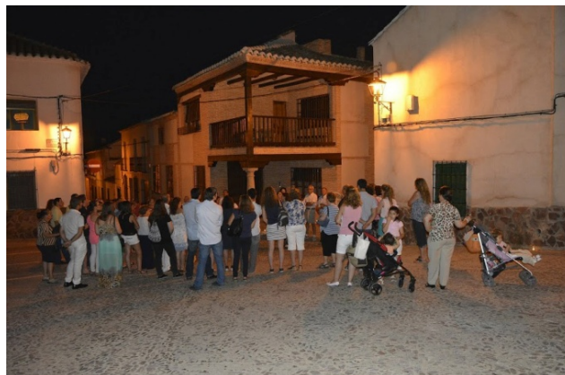
Rutas turísticas Moral te Cautiva