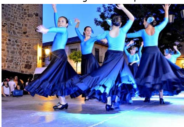
Sevillanas a cargo del taller flamenco de la UPE