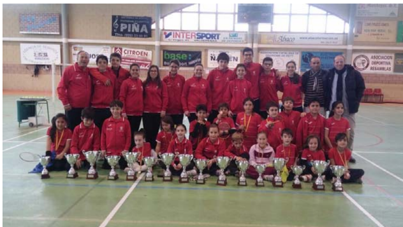
Cpto. Provincial Escolar 2014/15. Moral de Cva.

De esta manera, finaliza la temporada 2014/15 escolar y federada consiguiendo un año más unos magníficos resultados no exentos de sacrificio, entrega y dedicación.