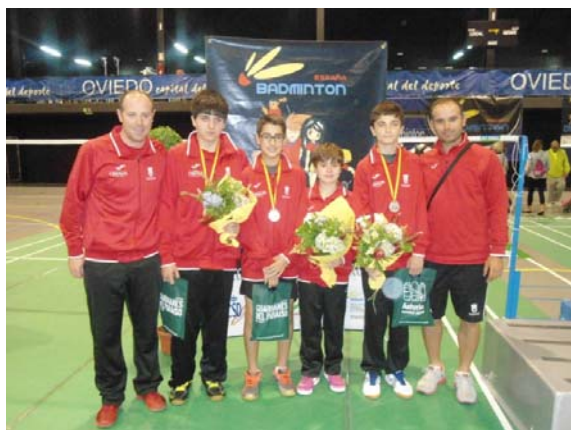
Cpto. de España sub 13. Oviedo