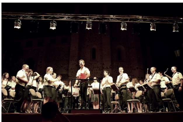
Encuentro de Bandas

Entre los días 27 de Junio hasta el 5 de Julio de 2015, se celebró la XIV Semana Cultural de Moral de Calatrava. Destacar la gran participación popular y asistencia a los numerosos actos que durante la misma se celebraron, como el encuentro de bandas, la carrera del melón, las rutas turísticas "Moral de te cautiva", bailes de salón, gala flamenca o el encuentro de encajeras, por mencionar algunos.