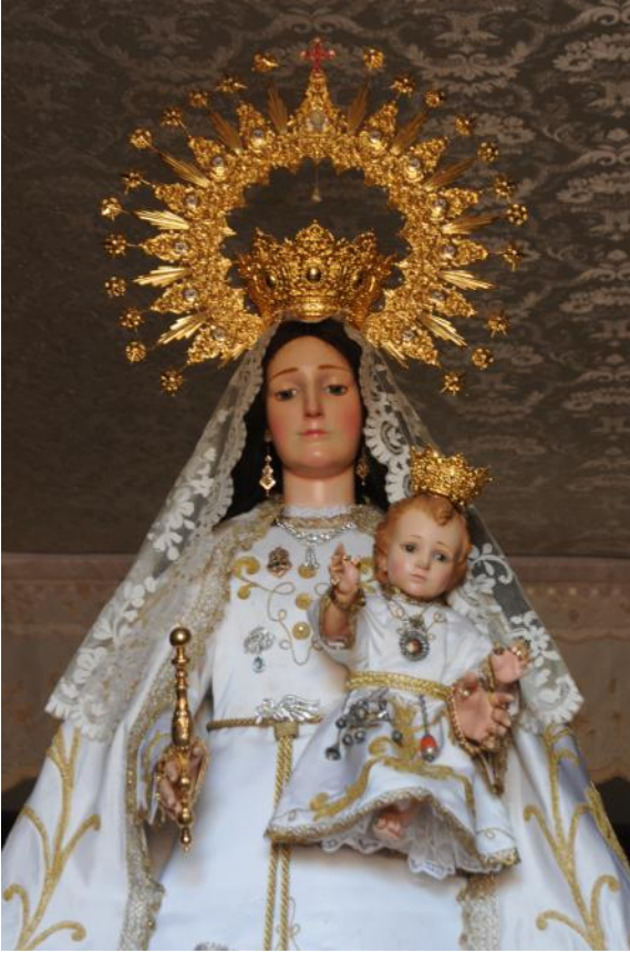
Nuestra Señora de la Sierra Patrona de Moral de Calatrava