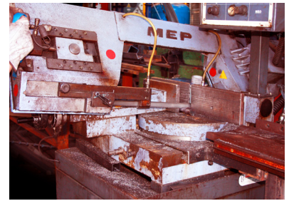
Proceso de Producción