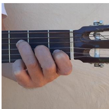
Fa / F facilitado Segunda cuerda del 1er traste, tercera del 2º y cuarta del 3º

Do Mi Fa Mi Sol Llevas años enredada en mis manos, en mi pelo, en mi cabeza, y no puedo más, no puedo más. Do Mi Fa Mi Sol Debería estar cansado de tus manos, de tu pelo, de tus rarezas, pero quiero más, yo quiero más. Do Mi Fa Mi Sol No puedo vivir sin ti, no hay manera, no puedo estar sin ti, no hay manera - a. (bis)