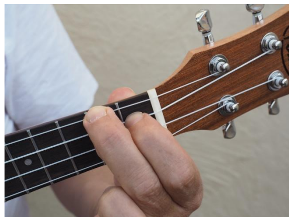
Tercera cuerdas del 1er traste, cuarta cuerda del 2º