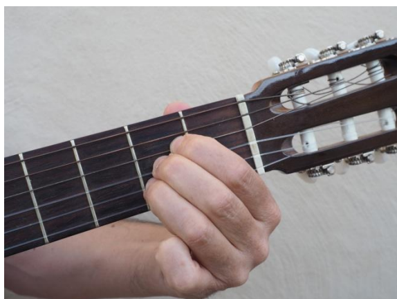
Cuarta, tercera y segunda cuerda del 2º traste