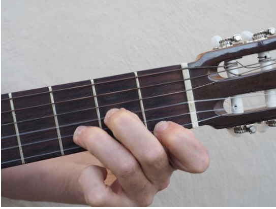
Primera cuerda del 1er traste, tercera cuerda del 2º traste y segunda cuerda del 3er traste