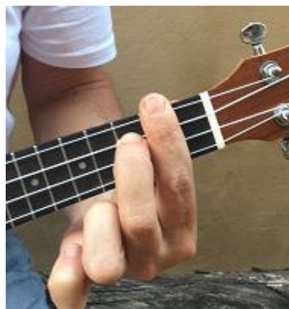
Todas las cuerdas pisadas (cejilla) en 2º traste y tercera cuerda del 3er traste