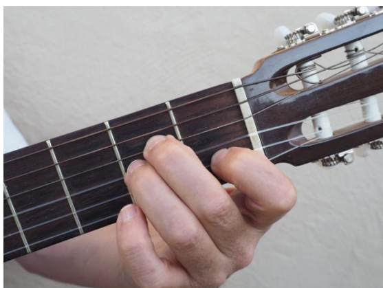
Segunda cuerda del 1er traste, cuarta y tercera del 2°