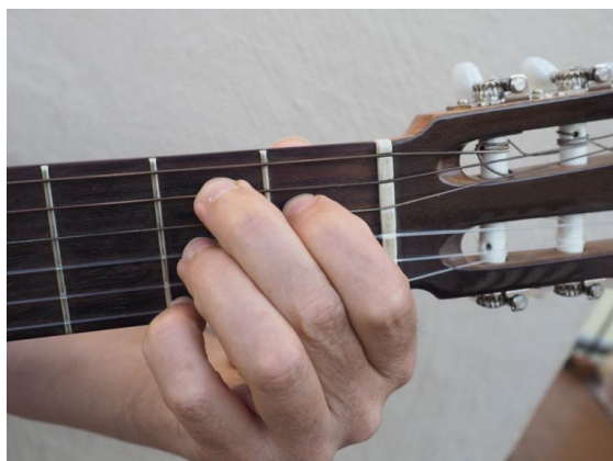
Cuarta cuerda del 1er traste, quinta, tercera y primera del 2º traste