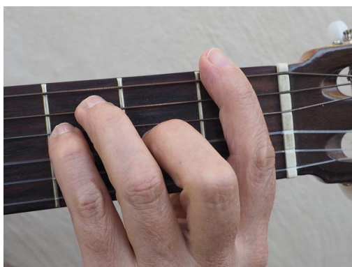
Cejilla 1er traste, tercera cuerda del 2º traste, Quinta y cuarta del 3er traste