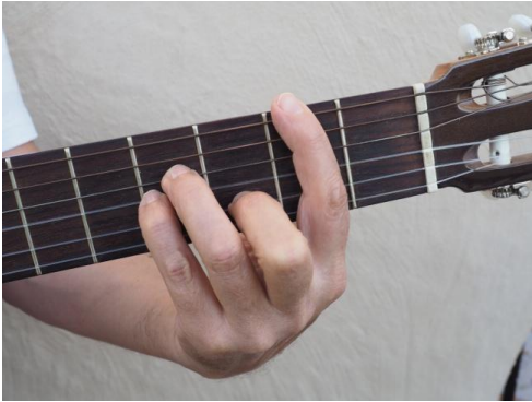
Cejilla en 2º traste, segunda del 3er traste, cuarta y tercera del 4º traste