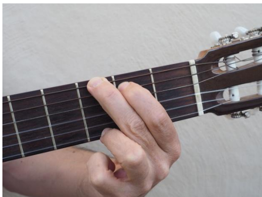
Quinta cuerda del 2º traste, sexta y primera del 3er traste