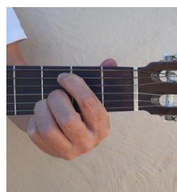
La# / Sib aflamencado