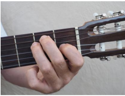
Mi / E

Tercera cuerda del 1er traste, quinta y Cuarta del 2º traste