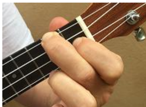
Fa / F