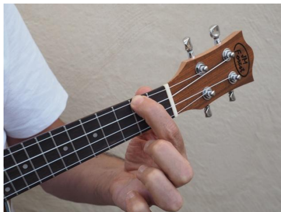
Cuarta cuerda del 2° traste