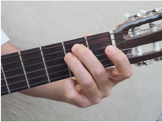
Mim / Em