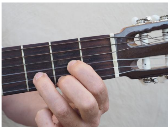
Tercera y primera cuerdas del 2º traste y tercera del 3er traste