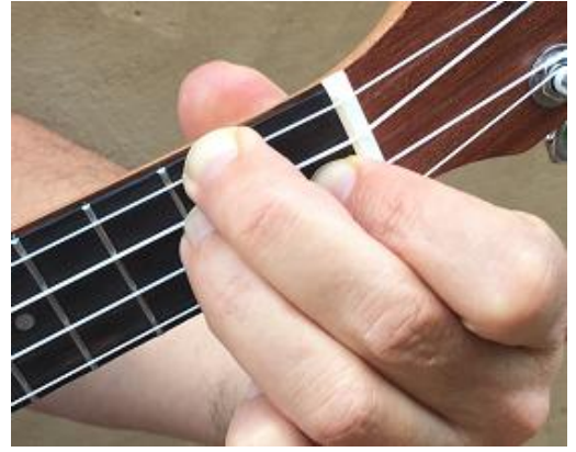
Segunda cuerda del 1er traste, cuarta y tercera cuerdas del 2º traste