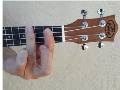
Primera, segunda y tercera cuerda del 2º traste y cuarta cuerda del 4º traste