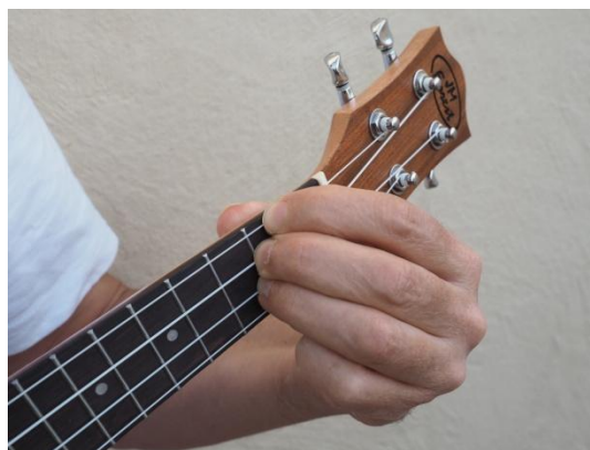
Cuarta, tercera y segunda cuerdas del 2º traste