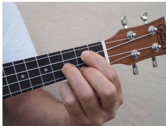
Tercera y primera cuerdas del 2º traste y segunda del 3er traste