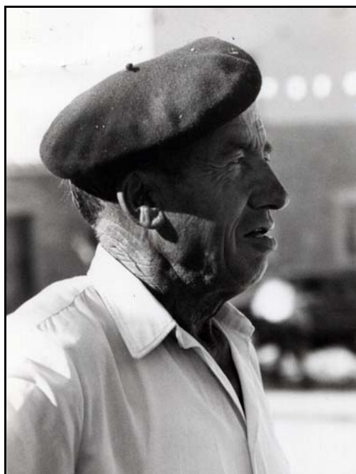
Recio rostro hacinense

ABOTAGARSE. v. Dicho del cuerpo de un animal o de una persona, hincharse, inflarse.