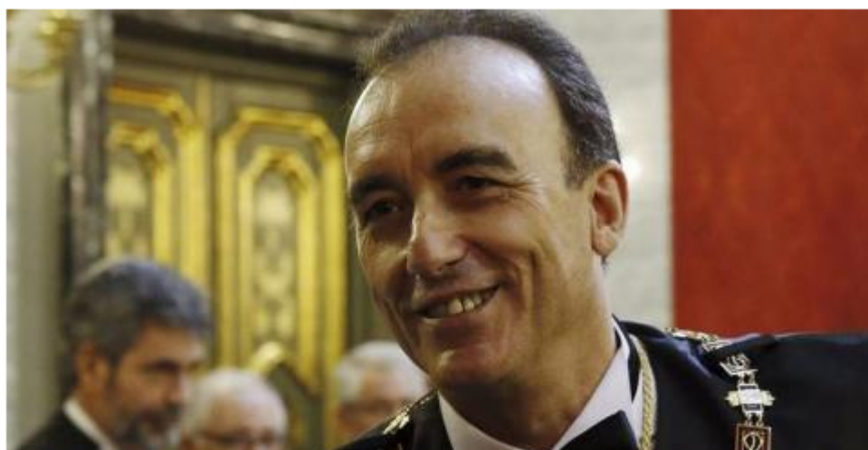
Manuel Marchena, en su toma de posesión como presidente de la Sala de lo Penal del Supremo, el pasado 3 de noviembre de 2014.