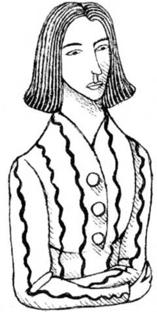
Philip K. Dick ¿Sueñan los androides con ovejas eléctricas? Blade Runner, Edhasa

Rick se inclinó hacia adelante y estudió a Pamina. Volvió a examinar el informe y se echó atrás, satisfecho. Este es el tercer androide Nexus-6 que veo, pensó: «Luba Luft». El sentimiento que exige su rol parece levemente irónico. Un androide fugitivo puede parecer una mujer vital, activa y hermosa; pero difícilmente puede decir la verdad acerca de sí mismo.