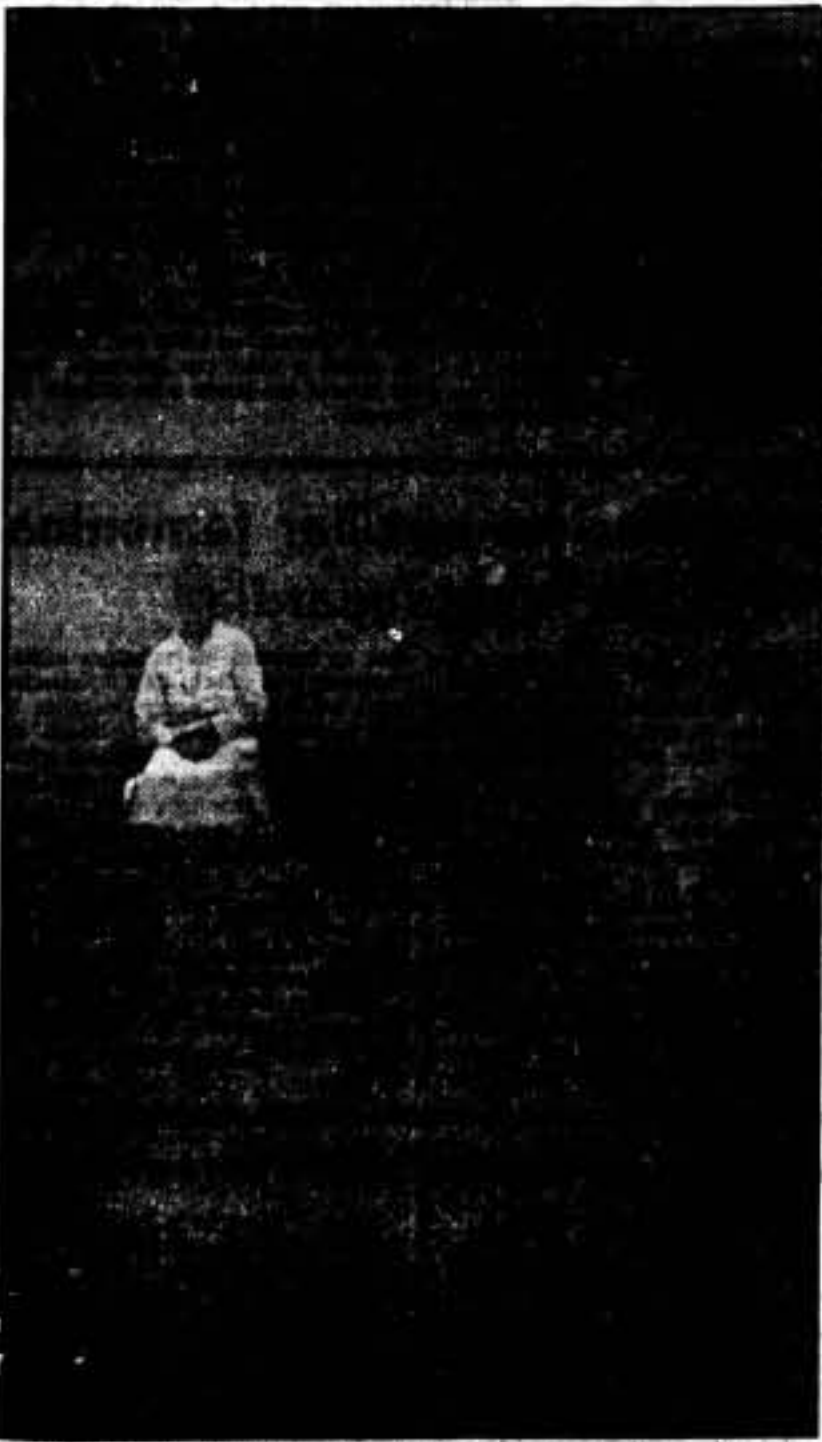
Esta mujer, que actualmente se encuentra en Colomer, es una de tantas con que los fascistas se han ensañado, cortándole el cabello.