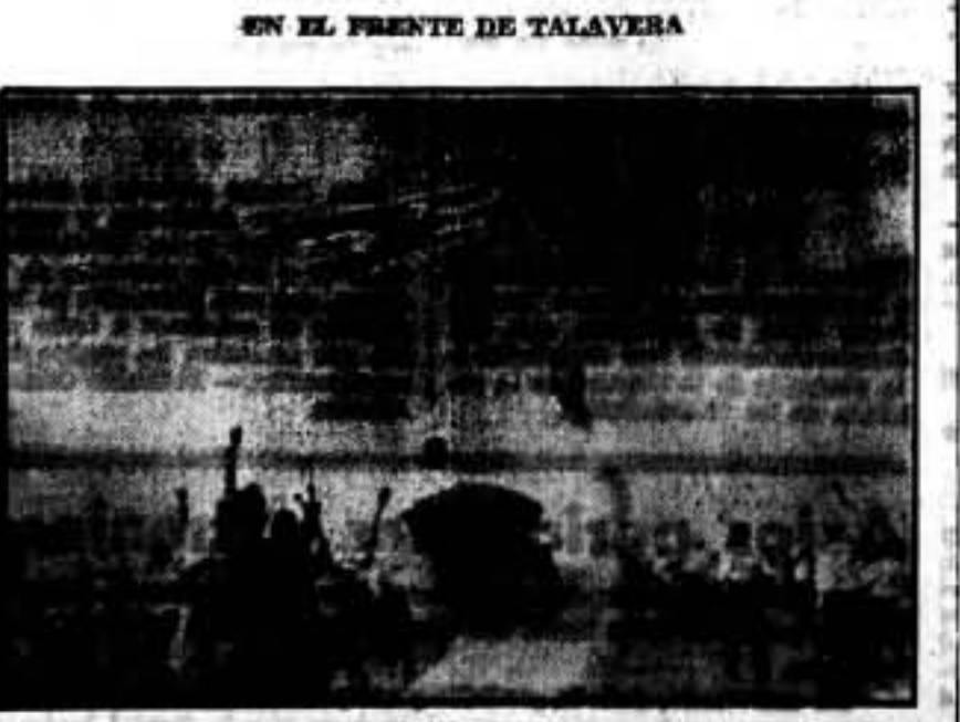
Uno de nuestros aviones es apuñalado frenéticamente por el pueblo, al regresar de una magnífica intervención en el sector talavero.

Lo hacemos resaltar por ser injusto el proceder de quienes han tratado de empujar la labor sangrada, heroica y desprovista de todo egoísmo particular, de estos bravos milicianos.