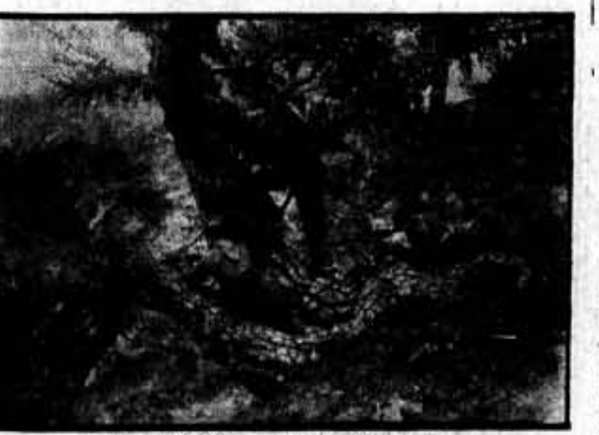
Nuestros soldados en el sector talaverano.

FREGOLI.—Abajo los hombres, La alegre divorciada, Bolero, Movimiento revolucionario de España.