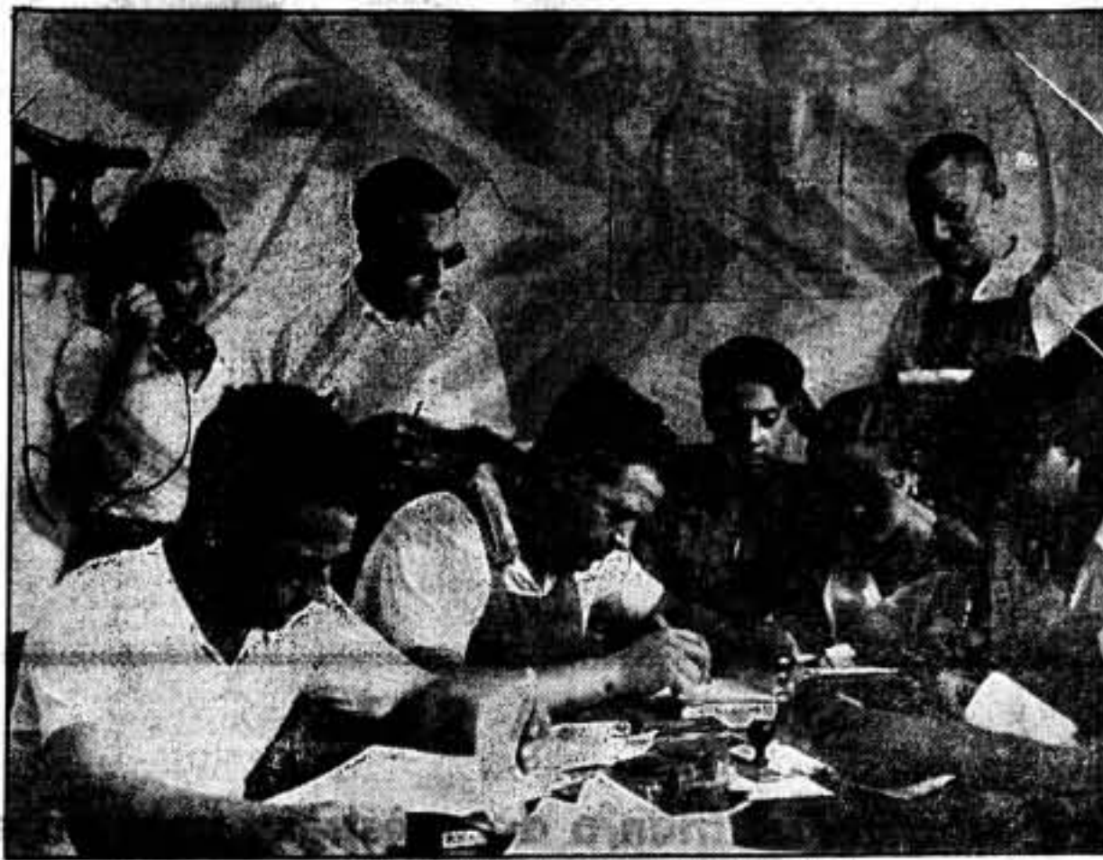
El Comité de fábrica de «La Seda de Barcelona»

—¿Cómo se llevó a cabo el nombramiento del Comité de fábrica?