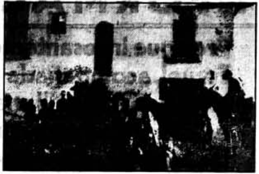
Un grupo de milicianos en la avanzadilla del cortijo de Las Torres, durante nuestra visita.