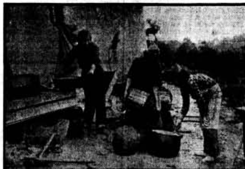
Las cantineras del sector talaverano, preparando la comida.