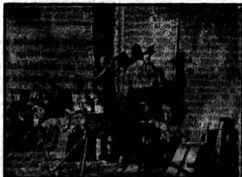
Puesto de ametralladoras en las avanzadas, custodiando los marcos.

Se comunica a todos los compañeros militantes de la C. N. T.-F. A. I. que quiera pertenecer a esta escuela; que las horas de inscripción son cada día, de seis de la tarde a nueve de la noche, advirtiéndoles especialmente, que no se admitirá inscripción alguna si no viene avalada con una carta de presentación del respectivo Sindicato a que pertenezca. — La Secretaría es la número 11, entresuelo, letra A. — La Comisión.