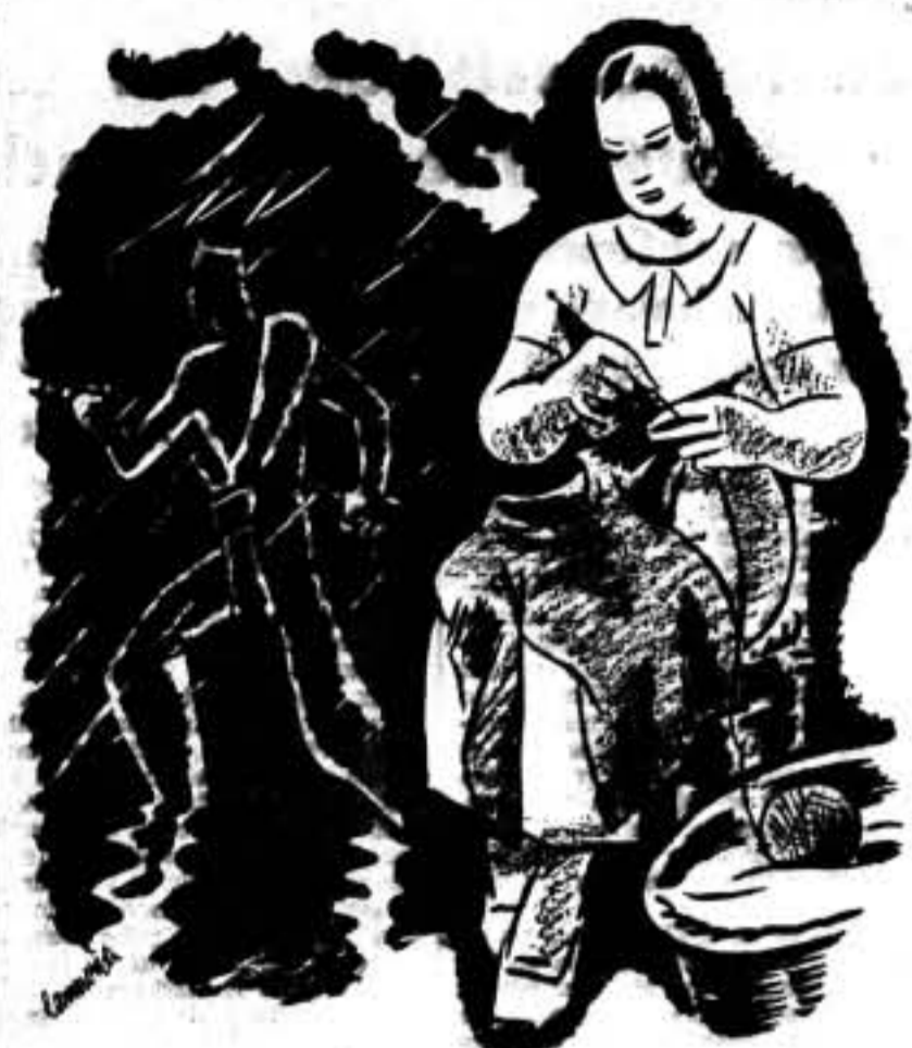
Nuestras hermanas, abnegadamente, contribuyen, con su trabajo, a preservar de los rigores del invierno a los bravos combatientes.