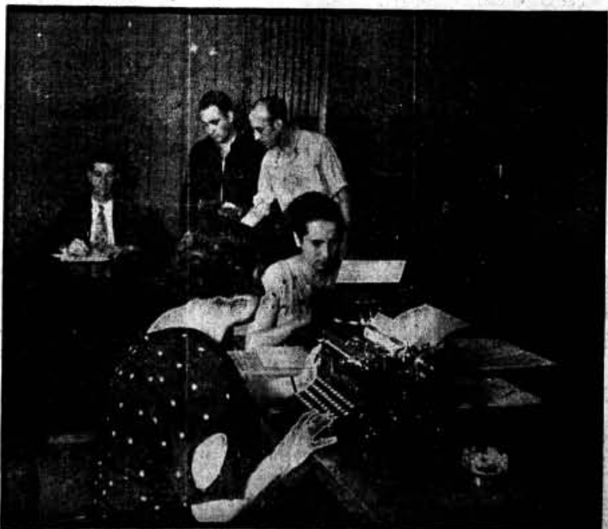
Comité Nacional de Relaciones del Textil y Fabril

Se confeccionaron unas amplias y atinadas bases de carácter moral y económico para presentarlas a la consideración de las patronales respectivas, primero de la región y luego, sin perder el estilo de ellas, aplicarlas también a las diferentes regiones de la Península, convencidos de que con ellas íbamos a dar más realce y más plenitud de vida a la industria de que nosotros vivimos y le deseamos la riqueza natural que tiene derecho a poseer. Ya habíamos repartido por todos los pueblos un folleto de sesenta y cuatro páginas, en las cuales constaban las seis sesiones del Pleno, el mitin de clausura y todo el articulado de las bases morales y de las materiales; estas últimas estaban especificadas por secciones y características de la industria fabril y textil. Al propio tiempo, ya se invitaba a todos los Sindicatos de la región a un Pleno que se tenía que celebrar en Badalona los días 25 y 26 de julio para hacer unas pequeñas e- miendas en los jornales presentados, e ir a la presentación de dichos jornales con la rapidez que se merecían. El Pleno, para que diese su conformidad