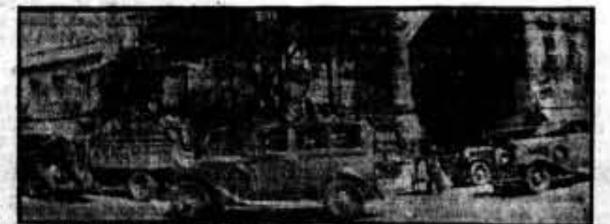
Llegada a Madrid de los milicianos que van a reforzar el frente de Extremadura.