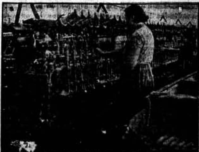
Sección de hilatura torcida.