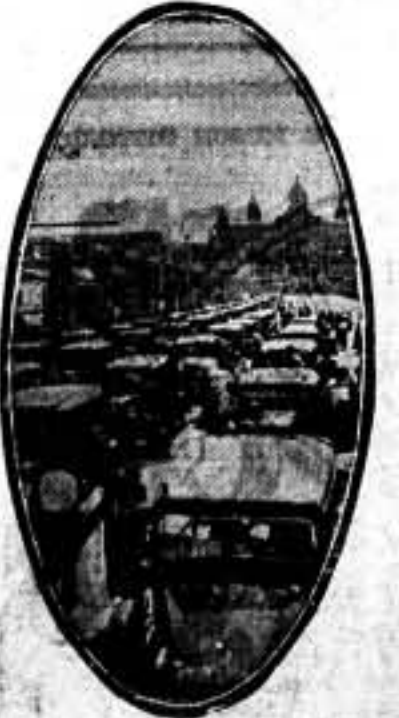
Los auto taxi, con su vistosa tonalidad rojinegra, esperan el momento de que sus conductores los hagan recorrer las principales calles de Barcelona.

Con datos estadísticos demostró que hasta ahora en España el presupuesto de guerra ha sido sensiblemente superior al presupuesto miserable de cultura. Inmediatamente cierra el acto el compañero Burillo con ventosas palabras.