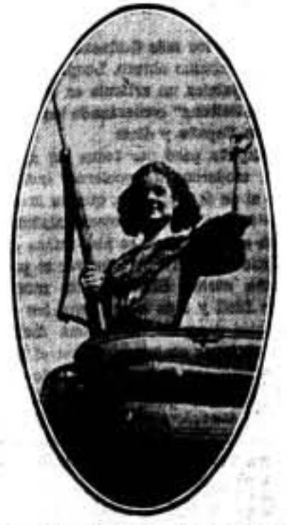
Una bella miliciiana, contrasta con la espléndida línea de un auto-taxi, en el triunfal recorrido de la columna de urgencia que se ha puesto en servicio