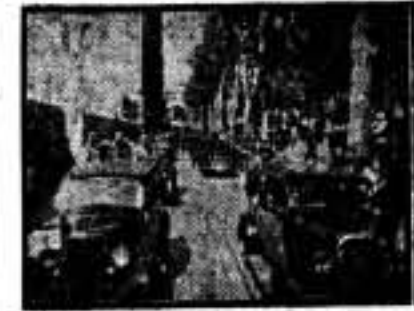
La muchedumbre, estacionada en las Ramblas, presencia entusiasmada el paso de la columna móvil

Llegaron los cinco desconocidos y los dos guardias de paisano a la calle de Felipe IV y ya en la casa, de-