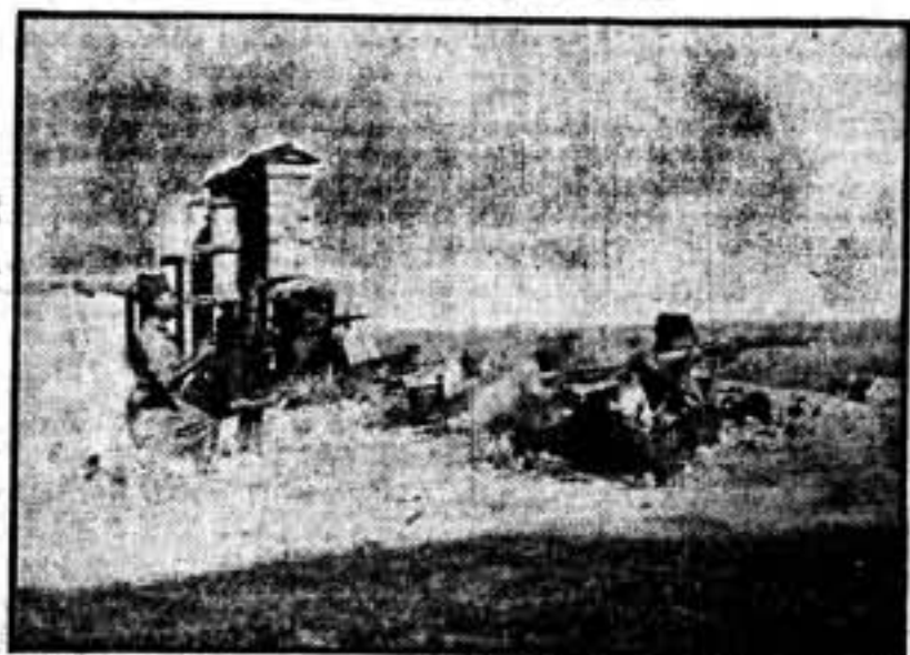
Nuestras milicias y fuerzas en la línea de fuego de Extremadura.