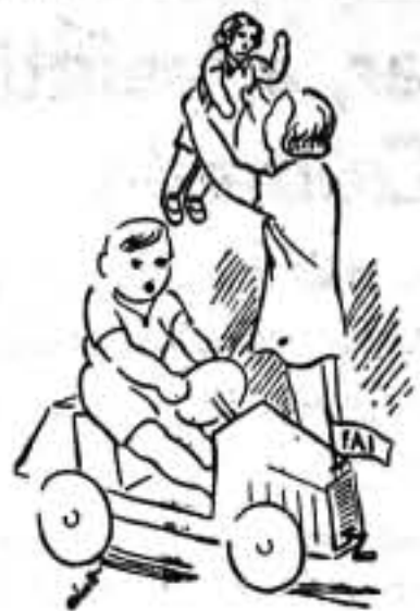
Juguetes para los niños.