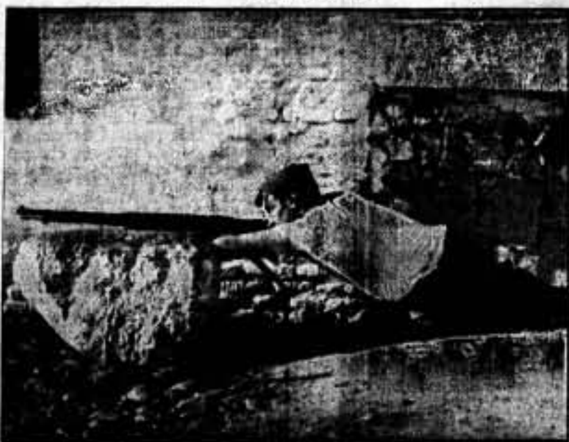
Uno de los guardias hace fuego contra el enemigo, durante la extraordinaria acción de nuestras fuerzas, en el día de ayer, en Extremadura.