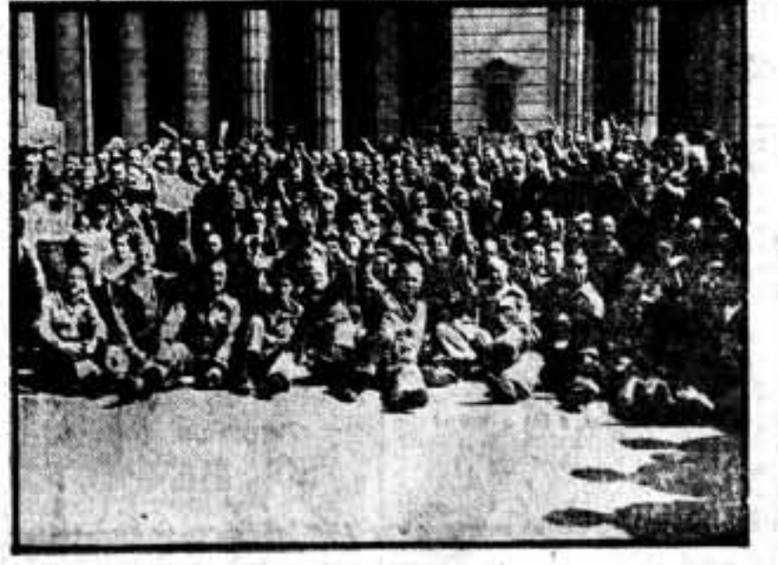
Los taxistas, con sus monos pardos, inician, alborozados, sus actividades dentro del nuevo orden revolucionario.