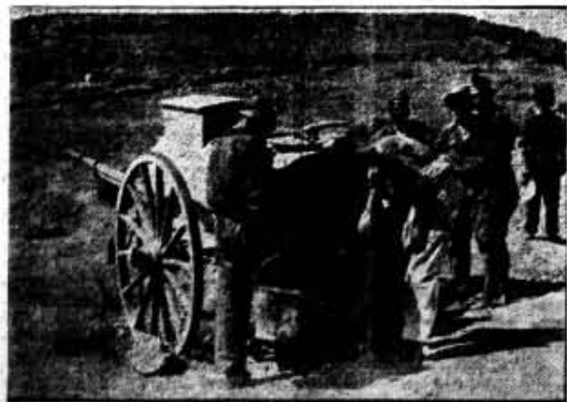
La aguada en los frentes ocultos.

Madrid, 5. - Durante los días 6 al 13 del actual, se celebrará en la playa de Madrid, una gran verbena, patrocinada por la C. N. T.