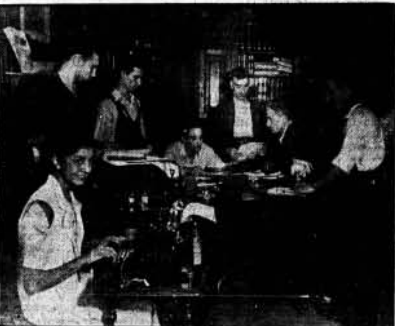
Secretaría de la Federación Local.

la compañera Montseny y no creemos necesario añadir nada más, puesto que hay bastante con lo dicho, para que los lectores se hagan un certero juicio de lo que es esta