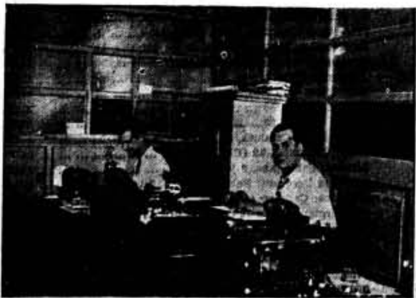
Departamento de la Redacción de SOLIDARIDAD OBRERA, en el Centro Regional.