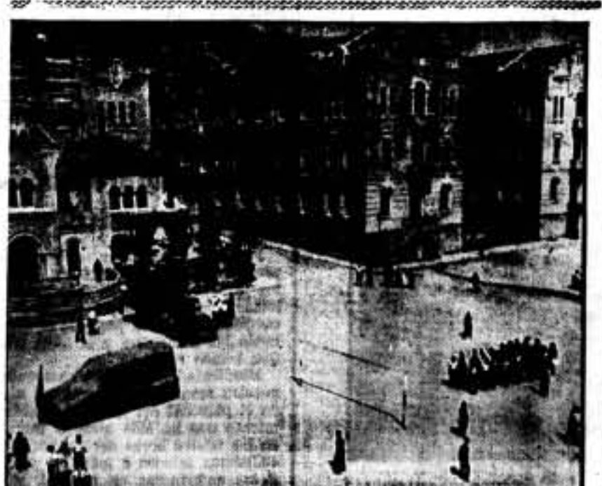
Pedralbes. — Cuartel General de las Milicias de Barcelona. Los milicianos haciendo la instrucción antes de partir para el frente de Zaragoza.

Camaradas, ciudadanos de Barcelona, pobladores de Cataluña, hermanos de España, Juventudes que hasta ahora, habéis tratado a la infancia oprimida como a un mendrugo caído de la mesa del opulento, y, a vosotros, juventudes estimadas que habéis crecido en el yermo de la adversidad, entre el polvo de la humillación. ¡Salud!