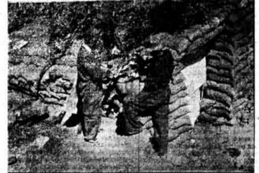
Los camaradas encargados de condimentar la carne, en el frente de Somosierra.

Madrid. - Un telegrama particular, de París, dice que los obreros de las fábricas de París, han decidido ayudar a sus hermanos españoles en la lucha contra el fascismo. - Febus.