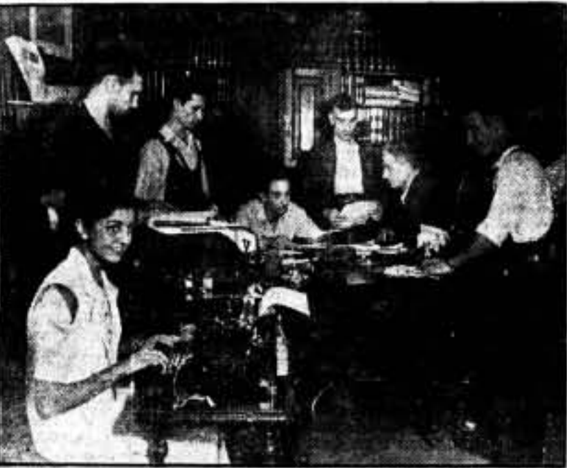
Secretaría de la Federación Local.

la compañera Montseny y no creemos necesario añadir nada más, puesto que hay bastante con lo dicho, para que los lectores se hagan un certero juicio de lo que es esta