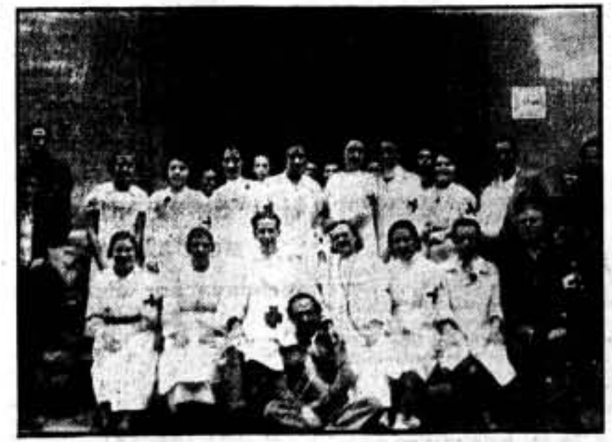
La Cruz Roja de la C. N. T. y la F. A. I., en San Sebastián