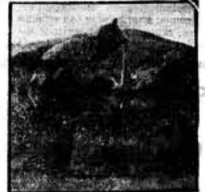
Carta a la esposa e hijos

Madrid, 5. - Boletín de guerra: Las últimas noticias recibidas confirman el afianzamiento de nuestras tropas en el frente de Talavera, donde se combate aún. En los demás frentes, no hay novedad de importancia que señalar.