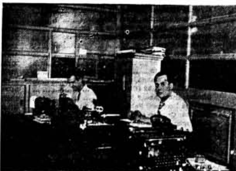
Departamento de la Redacción de SOLIDARIDAD OBRERA, en el Centro Regional.

Quizá sea interesante destacar el tono de serenidad que hemos procurado y conseguido dar a nuestra misión. No se trata de una lista de técnicos anotados distraídamente, sino de un trabajo concienzudo, hecho con cariño sobre cada técnico que se presenta y antes de ser enviado a los talleres o a las fábricas colectivizadas. Tenemos unos cuantos camaradas discretos dedicados a este servicio, que nosotros mismos llamamos policía. Nos hemos encontrado ya con alguna infiltración que ha sido resuelta inmediatamente, dando la sensación al interesado y a cuantos contemplan nuestra obra, de que no estamos entregados a un juego de niños y de que, al incorporarse a nuestras cosas, no se queda a salvo de responsabilidades. Queremos manos limpias y juego limpio. Aparte esta investigación personal, realizamos un trabajo de desbaratamiento, que se va perfilando. Primero, según las condiciones inte-