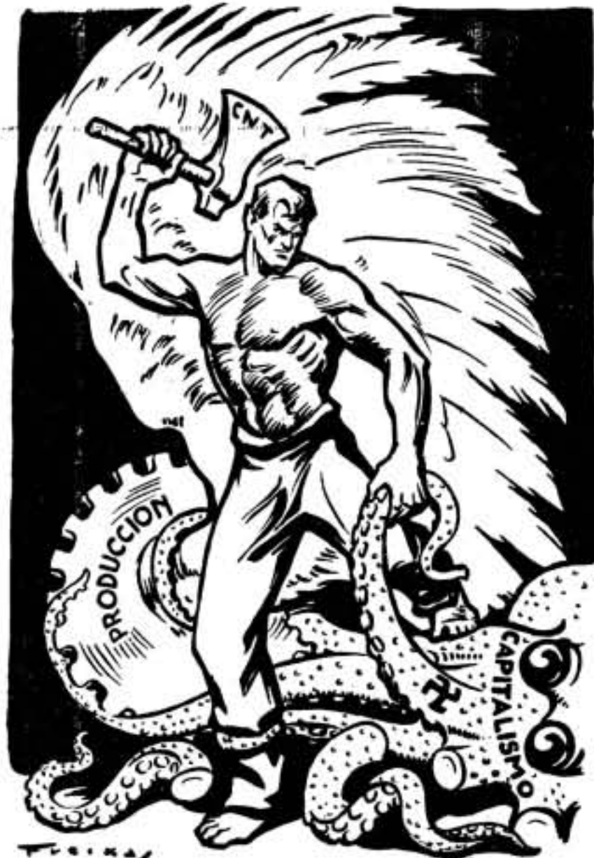
El pulpo del capitalismo está haciendo el último esfuerzo para retener entre sus tentáculos la producción que se le escapa, mientras el hacha poderosa de la C. N. T., manejada por el proletariado, va destronzándolo.

Sindicalmente hay muy poco que hacer por esa; todo lo tenéis hecho. Sin embargo, hombres en los frentes precisan muchos, y en otras épocas, ahí abundaron mucho los bravos y decididos a todo. Ahora, no sé.