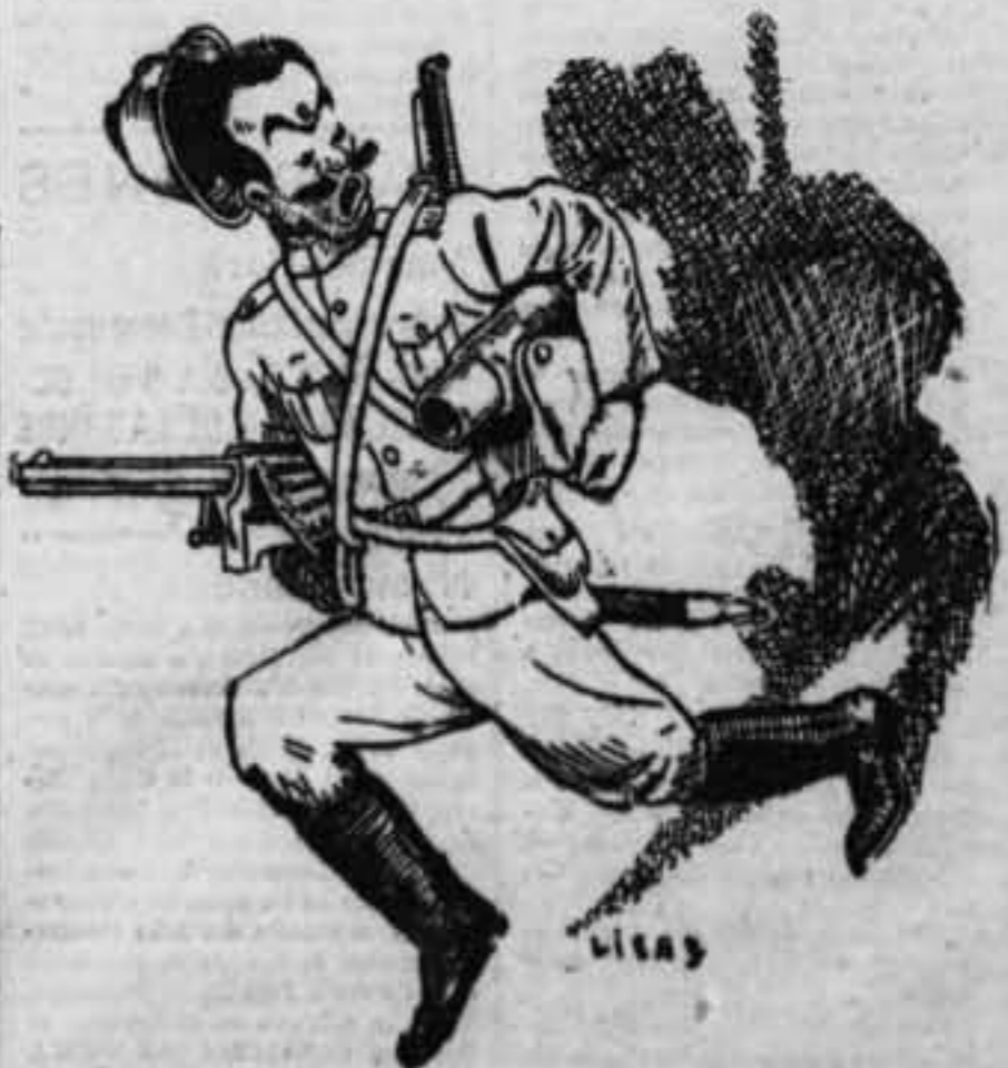
Un guardia de Seguridad que los heróicos