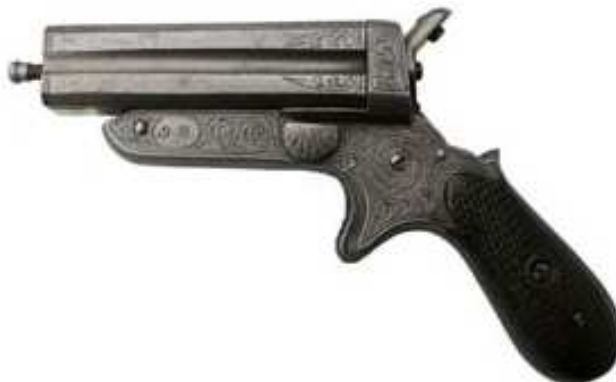
PISTOLA DE CUATRO CAÑONES, CALIBRE 9 mm, CEBO ANULAR, CAÑONES LONGITUD 80 mm. MACADA “9 M”, MANUFACTURA ANÓNIMA