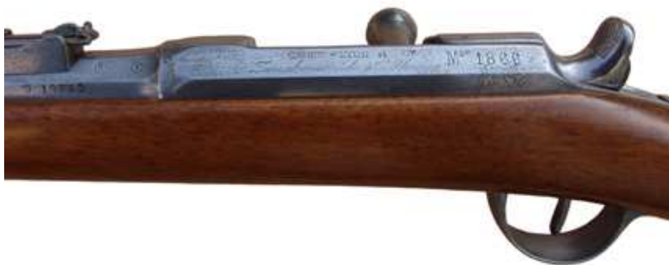
INSCRIPCIONES EN UN FUSIL CHASSEPOT CONSTRUIDO EN LA EUSCALDUNA, “CAHEN – LYON et Cie” “Zuazubizcar Isla y C a . Placencia”, Y “MLE 1866”.

En 1866 la sociedad “Zuazubizcar Isla y C a ” solicitó “privilegio de introducción” por “ Sistema de arma de fuego cargada por la recámara, que se aplica a las armas de guerra y caza ”, describiendo un cierre de tabaquera como el Snider, que figura entre los ensayados aquel año por la Subcomisión de Artillería. Almirante 1 indica que en 1867 atendió un contrato francés para la construcción de 30.000 fusiles Chassepot, construyéndose también en ella, el año 1870, los fusiles sistema Núñez de Castro utilizados en las experiencias comparativas con el Remington.