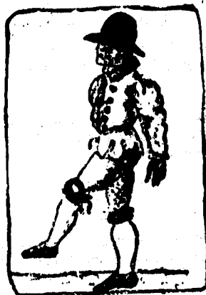
Levante al aire el pie izquierdo