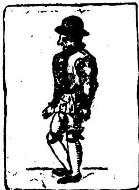
Marque el talón derecho