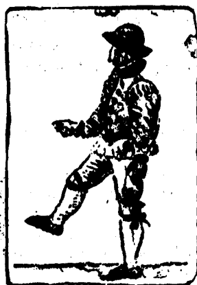
Levante al aire el pie derecho