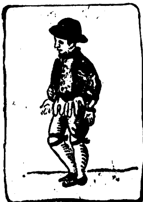
Marque el pie derecho