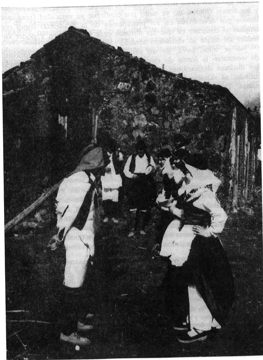
LÁM. III.—El sirinoque de La Palma parece ser la única danza actual de Canarias que tiene ciertas similitudes con el antiguo canario . (En la foto el Grupo de las Tricias bailando el sirinoque ).