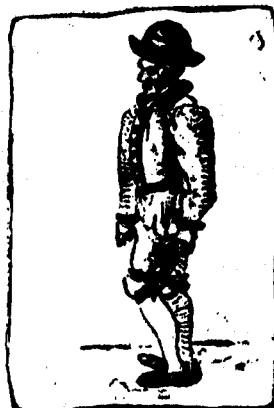
Marque el talón izquierdo