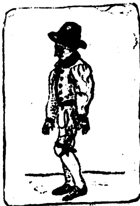
Marque el pie izquierdo