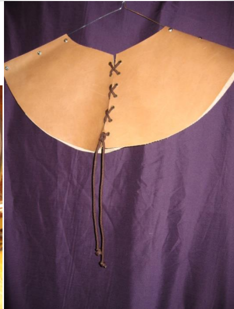
CRESPINA Y GORROS DE CABALLERO