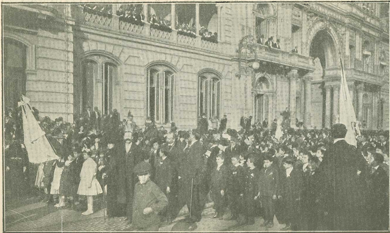
Procesión cívica. 9 de Julio de 1911.—Las escuelas frente á la Casa de Gobierno