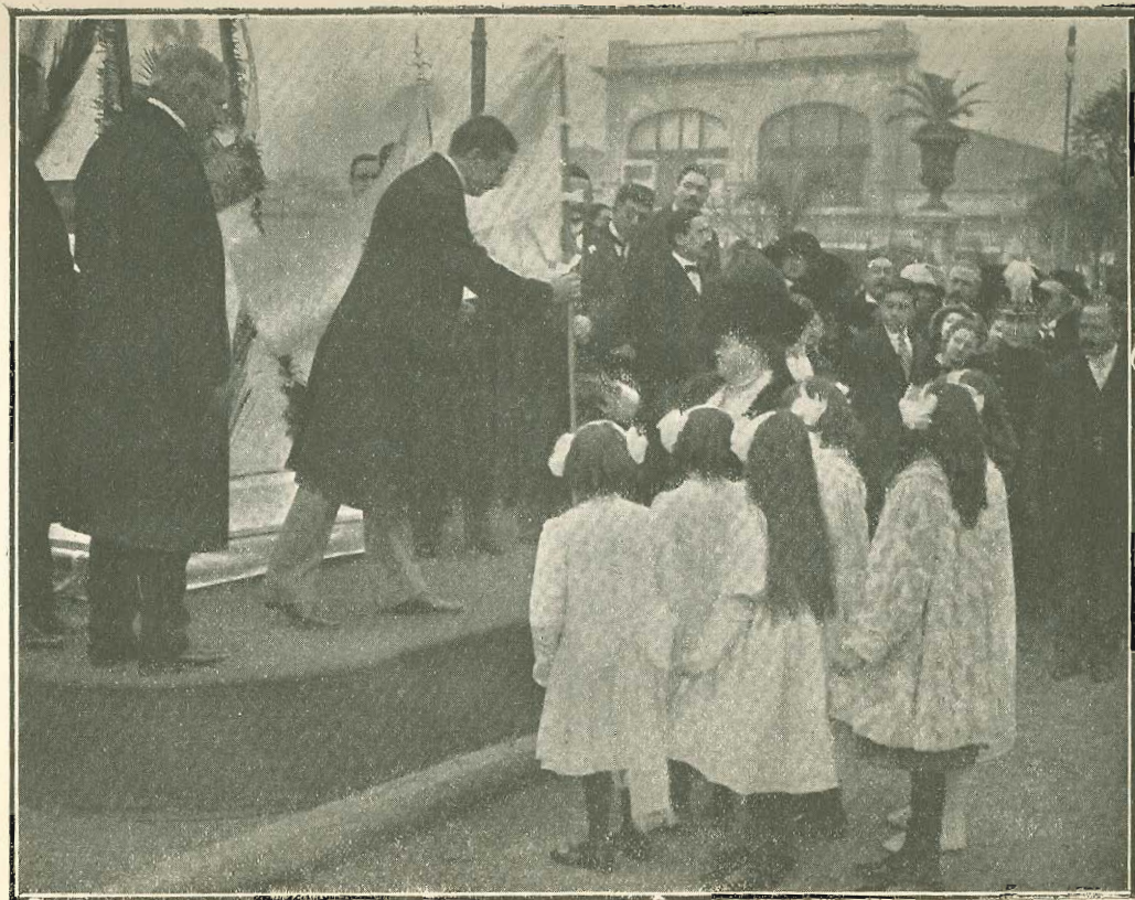
8 de Julio de 1911 — Entrega de banderas á las escuelas del Consejo Escolar 3.º