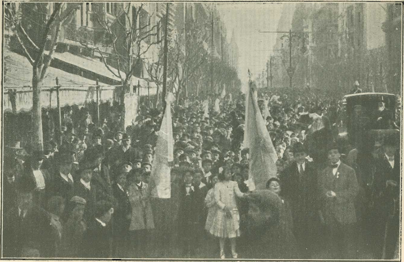
Procesión cívica. 9 de Julio de 1911. — Las escuelas en la Avenida de Mayo