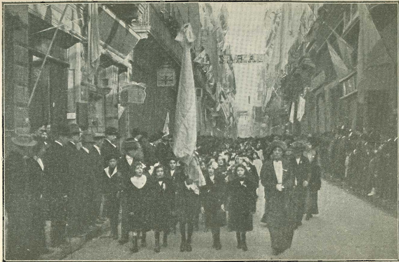
Procesión cívica. 9 de Julio de 1911 — Las escuelas en la calle Florida desfilando al son de canciones patrióticas