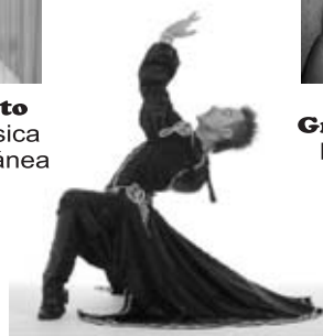
Yamil Annum Danza Árabe