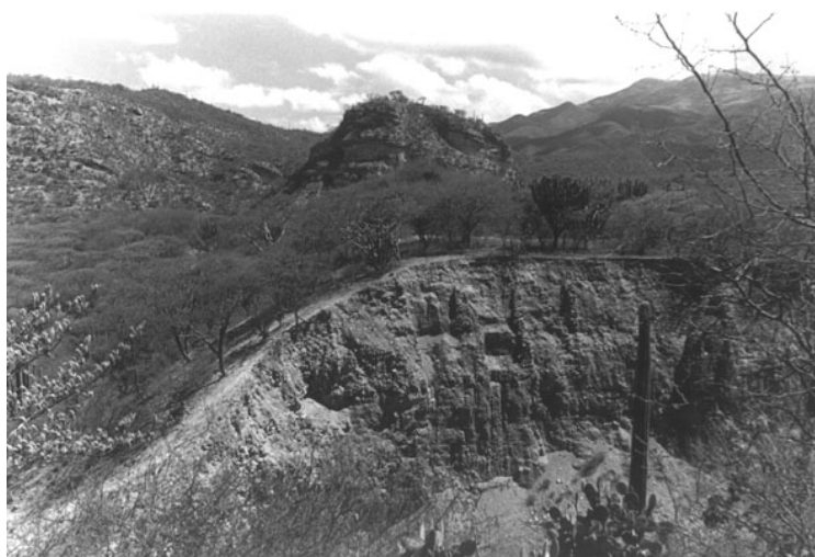
La Presa de Purrón, localizada en el valle Tehuacán – Coxcatlán, es la más antigua que se ha encontrado en mesoamérica.

La presa, construida por etapas a partir del año 750 a. C. y concluida antes del año 300 de nuestra era, mide 18 metros de altura, más de 400 metros de largo de lado a lado de la barranca, y de ancho tiene más de 100 metros en la base. Ella formaba un depósito de agua de aproximadamente 400 x 700 metros, con lo que pudo almacenar más de dos y medio millones de metros cúbicos de agua.