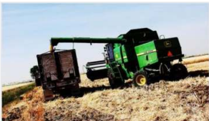
Los acopiadores piden liberar el comercio de trigo

La Federación de Acopiadores elevó una carta al Ministerio de Agricultura reclamando urgentes cambios en el sistema de comercialización.