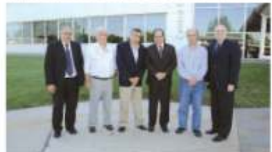
Autoridades de la empresa recibieron a funcionarios nacionales.

La propuesta surgió debido a la vinculación comercial que la empresa ya mantiene con países de África, en el marco del crecimiento que registra en los mercados internacionales.