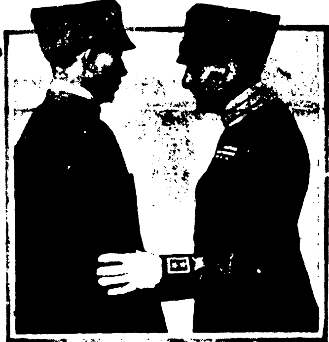
Captain D'Annunzio in Fiume.

Retrato del aguerrido soldado-poeta Gabriel D'Annunzio, en su aventura de Fiume. El gran capitán, cuyas hazañas han tenido en jaque a casi todas las potencias Aliadas, a Italia, su patria, inclusive, viste un simple uniforme de soldado, aun cuando se le distingue por sus condecoraciones que lleva sobre el pecho. En la fotografía aparece, no recitándole uno de sus bellos poemas a uno de sus muchos admiradores, sino dándole una orden militar a uno de los patriotas que nutren su valeroso ejército.