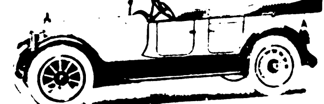
EL MAS VELOZ SOBRE RUEDAS UN PACKARD

De Packard se compran todos los records mundiales de velocidad en el mundo