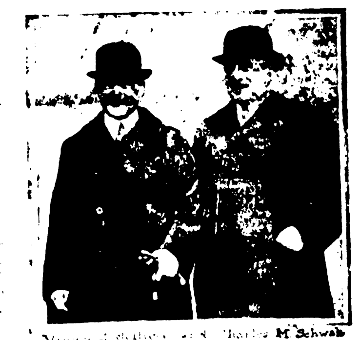
Visita del Almirante Jellicoe a los Estados Unidos.

El Almirante Jellicoe, comandante en jefe de la Armada británica, visitará los Estados Unidos durante su gira por América. Su visita será muy provechosa para el intercambio de experiencias navales entre las dos naciones.