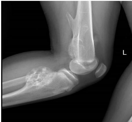
Fig.3. Tumoración del peroné desplazando en valgo la metáfisis proximal de la tibia.