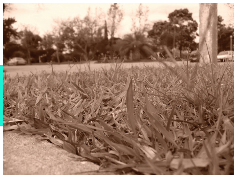
Guillermo Velásquez - "En 30 años..."

Se recibieron propuestas de todo el país. De las 129 fotos presentadas, se seleccionaron 25 trabajos que incluyen una fotografía, su título y texto.