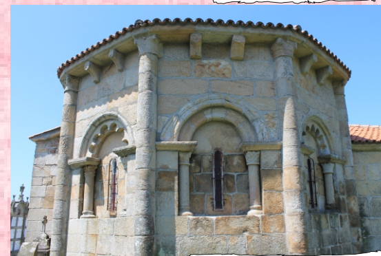
Igrexa de Losón

O percorrido continúa pola corda do monte Carrio con varios miradoiros naturais. Logo xa en descenso pasamos preto da estación rupestre de Brenzós de Arriba e pola chamada Pena das Cruces que ten gravouras de distintas épocas. A parte final permite visitar o castro e a igrexa románica de Losón e o roteiro remata ao pé do santuario do Corpiño.