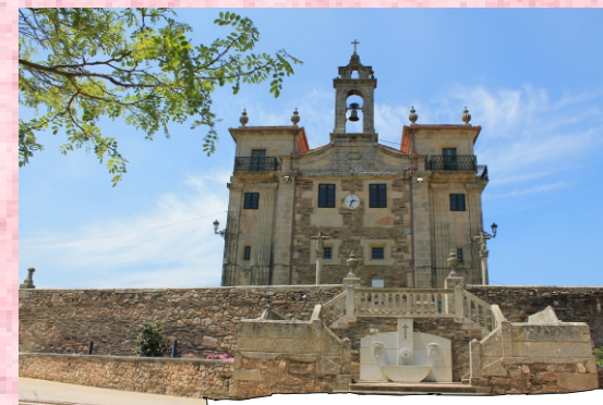
Santuario do Corpiño