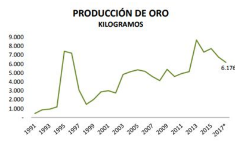
Figura 2. Producción de oro