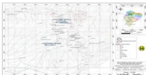
Figura 1: Área concesión de Cooperativa Minera Bella Rica