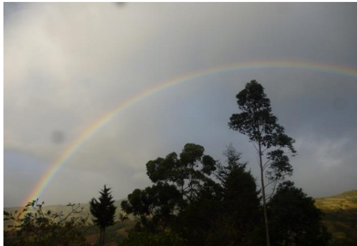
Imagen 17. El aro iris

Fuente: Adiel María Guamanga Catuche.2013