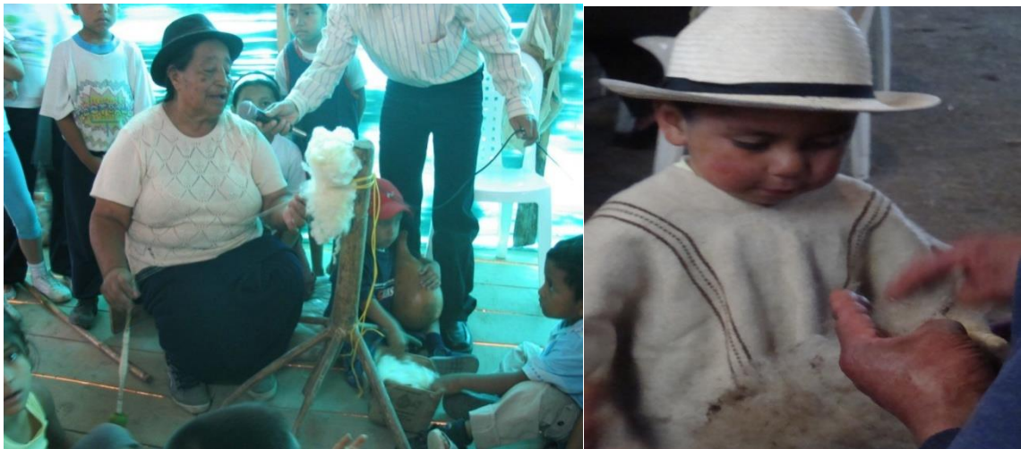
Imagen 12. La mayor hilando. Cabildo Yanakona de Popayán

En qué momento se nos enredaron los hilos y se nos cambió la vida, antes de los años sesenta se tenía de dos a seis ovejas de las cuales se “tusaba” la oveja en épocas de luna creciente y según el tamaño de la oveja se obtenía de una a dos libras de lana, la cual se tizaba y se hacía un guango y se colocaba en un madero llamado chanchuala con tres patas, que comúnmente se utilizaba el palo de sangregado y con una puchica que a la parte inferior se le coloca un piruro se da inicio a la hilada, terminada la hilada se procede a envolver el hilo en un aspador, en forma de equis, de lo cual sale la madeja, se pone a hervir la madeja para que le salga la grasa y se pone a secar y luego se hace el cururo quedando listo para el tejido.