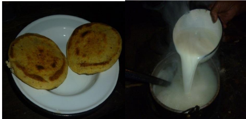
Imagen 3. Comidas tradicionales Yanaconas

las correrías con la virgen y el niño Dios después del 24 de diciembre, hasta el 28 del mismo mes, en todas estas actividades se preparan la alimentación tradicional sustentada en el maíz, el mote, el pringa pata, los envueltos, las arepas, la mazamorra.