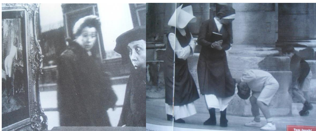
Imagen 4. La sexualidad como prohibición

En el tejido de pensamientos de las diferentes culturas, la sexualidad era un acto impuro y en otras se aceptaba como una bendición para procrear. Desde el inicio, el tema de la sexualidad ha sido considerado como un tabú, algo que se debe ocultar, aunque han surgido movimientos más liberales, basados en el desarrollo integral de la persona que ha dado paso a buscar estrategias para vivenciar la sexualidad como un acto natural.