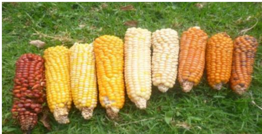
Imagen11. Los colores de maíz

Es un círculo que está girando constantemente sin dejar de repetir el proceso que se hace año a año, es la palabra de los sabios que camina a través de la oralidad alimentando sus sueños y las esperanzas de seguir viviendo en la mentalidad de las futuras generaciones que replicaran la abundancia y riqueza que guarda cada semilla de vida que la sustenta en la fertilidad y el sostenimiento de la dualidad. En cumplimiento a la ley de origen.