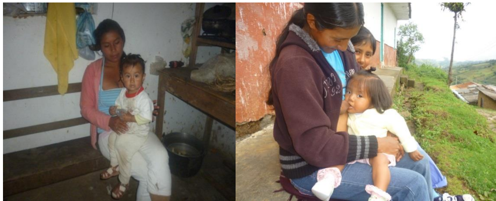
Imagen 9. Madres de familia de la vereda de San Juan

tres limpiezas durante su desarrollo para que el maíz granara. La primera cuando la mata es bebe y necesita que la consientan, la mata se torna amarillenta (se debe limpiar muy bien), la segunda cuando la mata está astillando o cabellando, se torna muy alegre su color es verde oscuro fuerte (se debe tólar para arrimarle tierra a la mata), la tercera cuando la mata está señoreando o zaraceando (se quita las hojas traseras y el monte más alto). Con este proceso se esperaba la cosecha entre los meses de julio y agosto y se culmina con el descañeo .