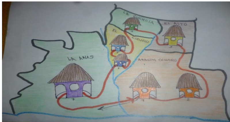
Imagen 18. Mapa de la vereda de Aragón

vivo y andante, por lo tanto los siete capítulos son rotatorios que se trabajaran en los cinco días de la semana, eso quiere decir que todos los sectores tienen la garantía de disfrutar y acceder al conocimiento, lo que sigue solo es una estructura de ubicación de contexto, la comunidad está dividida en cinco sectores cuya distancia de las casas del conocimiento oscila entre medio kilómetro a 400 y 300 metros, es una distancia bastante cómoda para el desplazamiento de los estudiantes, que en tiempo significa unos 20 a 30 minutos, para una mejor ubicación y comprensión del lector se levantara un mapa.