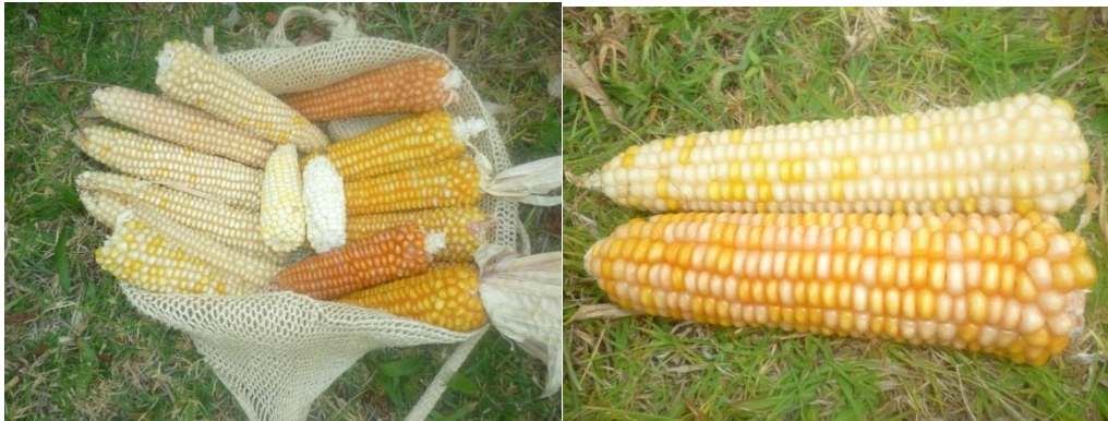
Imagen 8. El maíz principio de vida