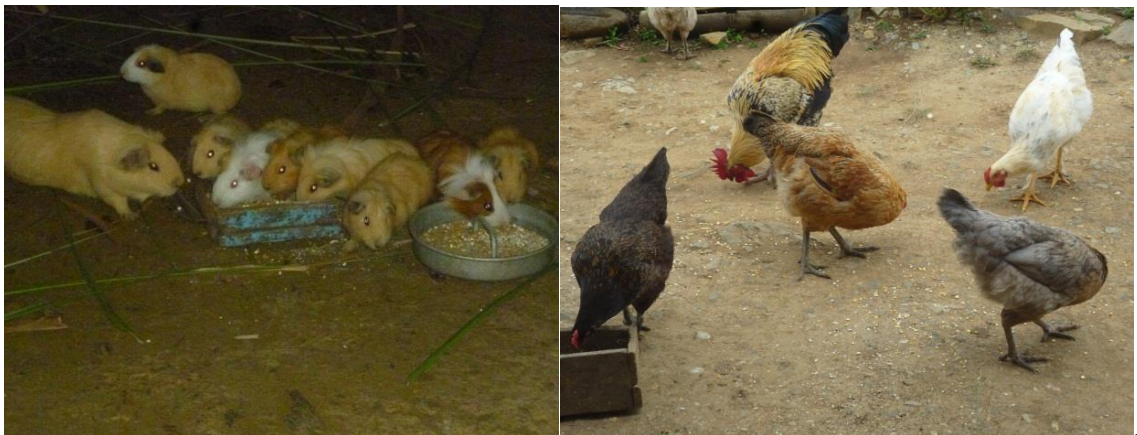
Imagen 2. Imágenes de gallinas y curíes

La comunidad de Aragón cuenta con un clima cálido, favorable para las actividades agrícolas y pecuarias que sustentan la parte económica de las familias, por ejemplo en la agricultura predomina el maíz, el café, la caña, la arveja, el trigo entre otros cultivos. En cuanto a lo agropecuario, prevalecen el ganado, los curíes y las gallinas, todas estas actividades son las entradas económicas de las familias de esta comunidad.