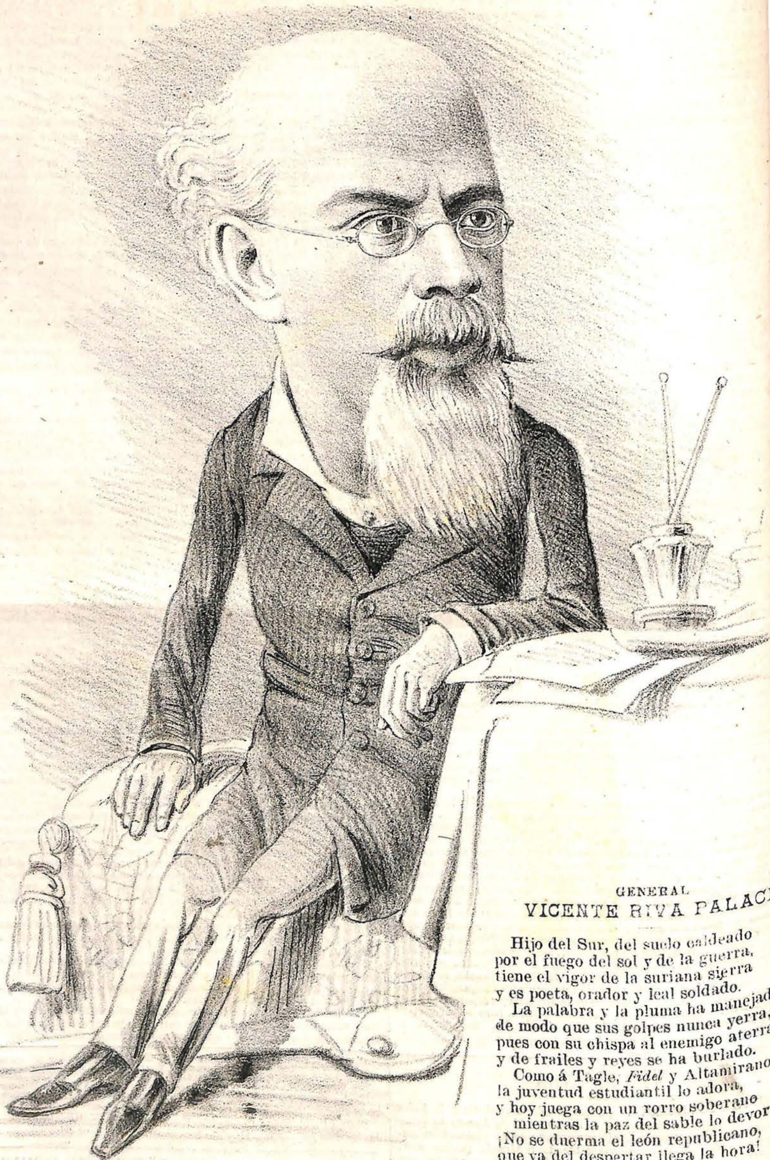
GENERAL VICENTE RIVA PALACIO

Hijo del Sur, del suelo caldeado por el fuego del sol y de la guerra, tiene el vigor de la suriana sierra y es poeta, orador y leal soldado. La palabra y la pluma ha manejado de modo que sus golpes nunca yerra, pues con su chispa al enemigo aterra, y de frailes y reyes se ha burlado. Como á Tagle, Fidel y Altamirano, la juventud estudiantil lo adora, y hoy juega con un rorro soberano mientras la paz del sable lo devora. ¡No se duerma el león republicano, que ya del despertar llega la hora!