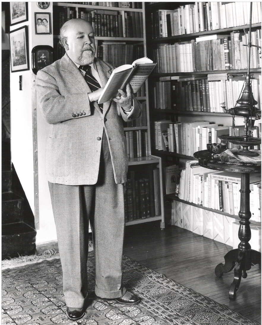
En la Capilla Alfonsina, ca. 1957.