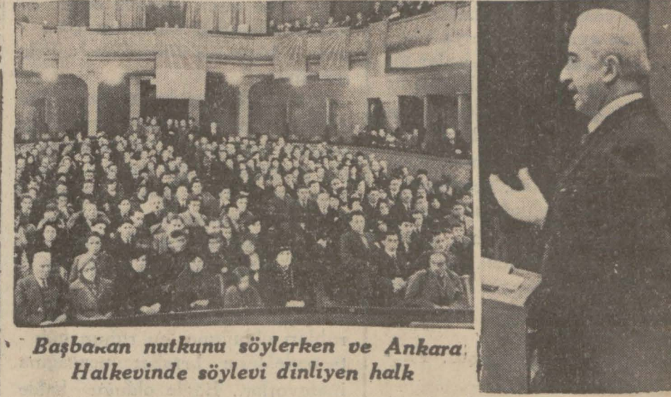
Başbakan nutkunu söylerken ve Ankara Halkevinde söylevi dinliyen halk