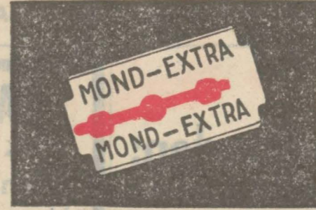
MOND - EXTRA 10 adedi 50 kuruş