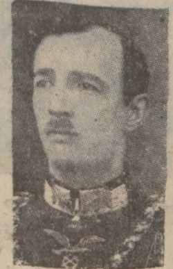
Arnavud Krâli Zog

İngiliz gazetelerine göre Kr. Ahmed Zogonun İtalyan vesayeti den yakayı kurtarmak için uğraşmağa başlaması üzerine Arnavudluk maliyesi İtalyanın verdiği tasulattan mahrum kaldığı için çarşaları bombros kalmıştır. Haricet bir kredi bulunabilmesi de imkânsız bulduğundan artık Arnavudluk için ya mutlaka iflâs veyahuda Arnavudluğu İtalyanın bir müstemlekesi haline getirip gene İtalyan (Arkası dördüncü sahifede)