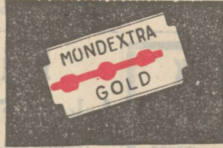
MOND - EXTRA GOLD 10 adedi 75 kuruş