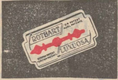
ROTBART - LUXUOSA 10 adedi 150 kuruş

Tekmil dünyaca tanınmış olan ROTBART - MOND - EXTRA tıraş bıçaklarının 10 adedlik paketlerinin fiyatları aşağıda ayrı ayrı gösterilmiştir. Muhterem müşterilerimize 10 adedlik paket satın almalarını kendi menfaatleri için dostça tavsiye ederiz. MINORA tıraş bıçağı da bu fabrikanın imal gerdesidir. Tekmil Boenos Ayres ahalisi MINORA tıraş bıçağı kullanır.