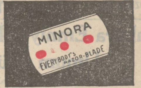
MINORA 10 adedi 35 kuruş

Her yerde satılır. Toptan satış : Galata Kürkçübaşı Han No. 4