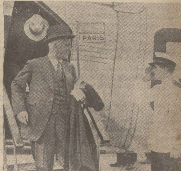
İngiltere Dış Bakanı Sir Con Simon Paris seyahatinde tayyareden inerken

İngiliz Dış İşleri Bakanının, Berlinde (Arkası dördüncü sahifede)